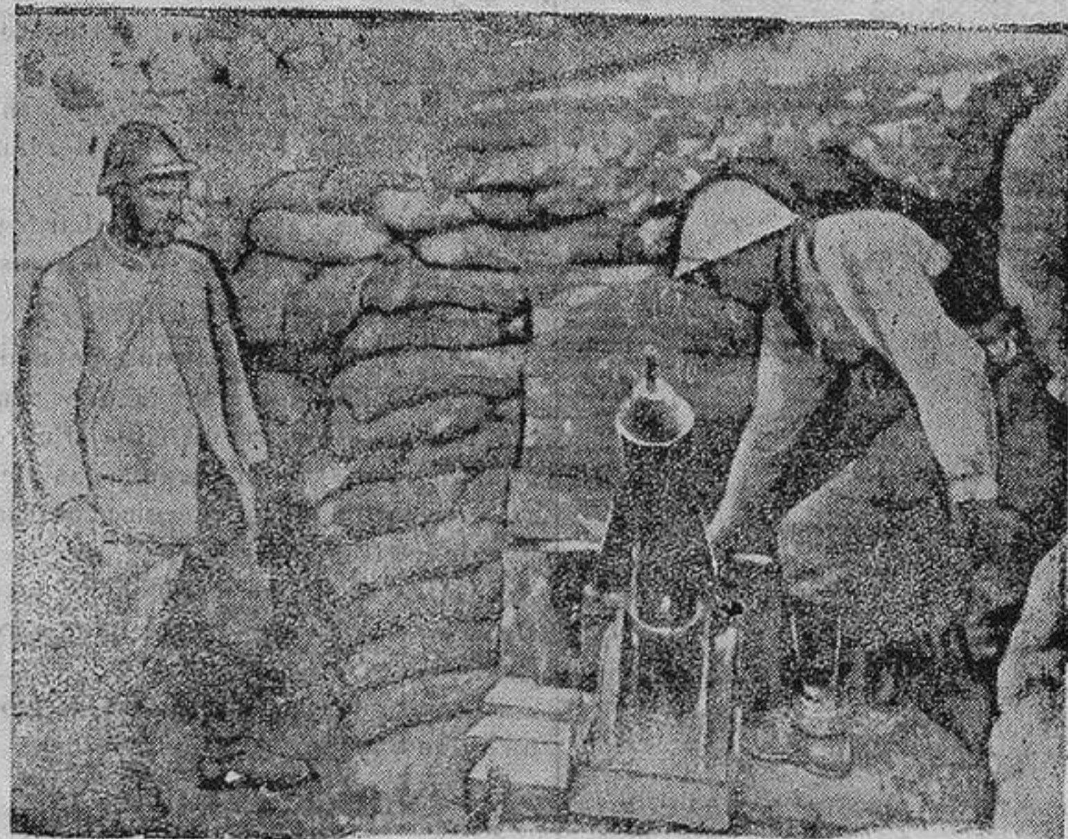
LANZA BOMBAS DE TRINCHERA