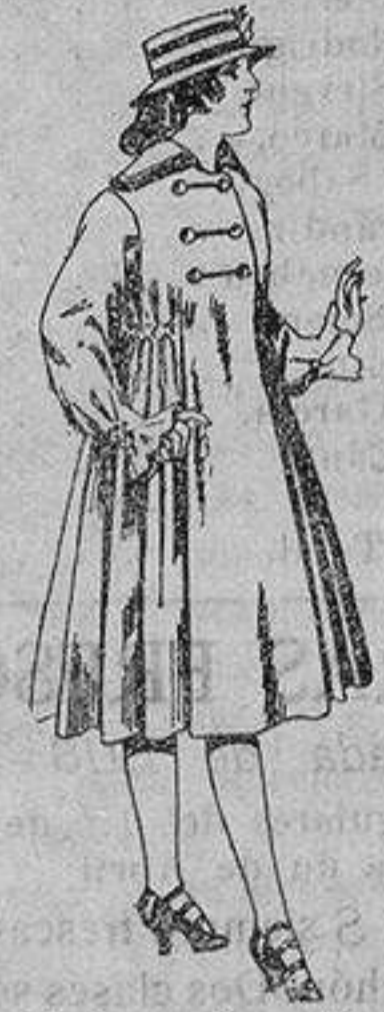
Abrigos de patén, para jovencitas de 11 a 15 años. De ptas. 35 a 50