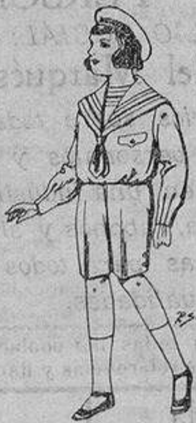
Trajes de patén para niños de 4 a 9 años. De ptas. 9 a 22