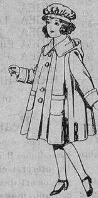
Abrigos de gabarri-na impermeabiliza-da para niñas de 4 a 12 años. De ptas. 40 a 70