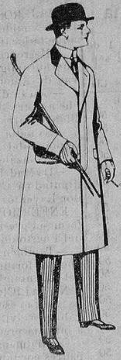
Gabanes de patén, meltón y cheviot, con forros seda, sa-tén o esocés. De ptas. 110