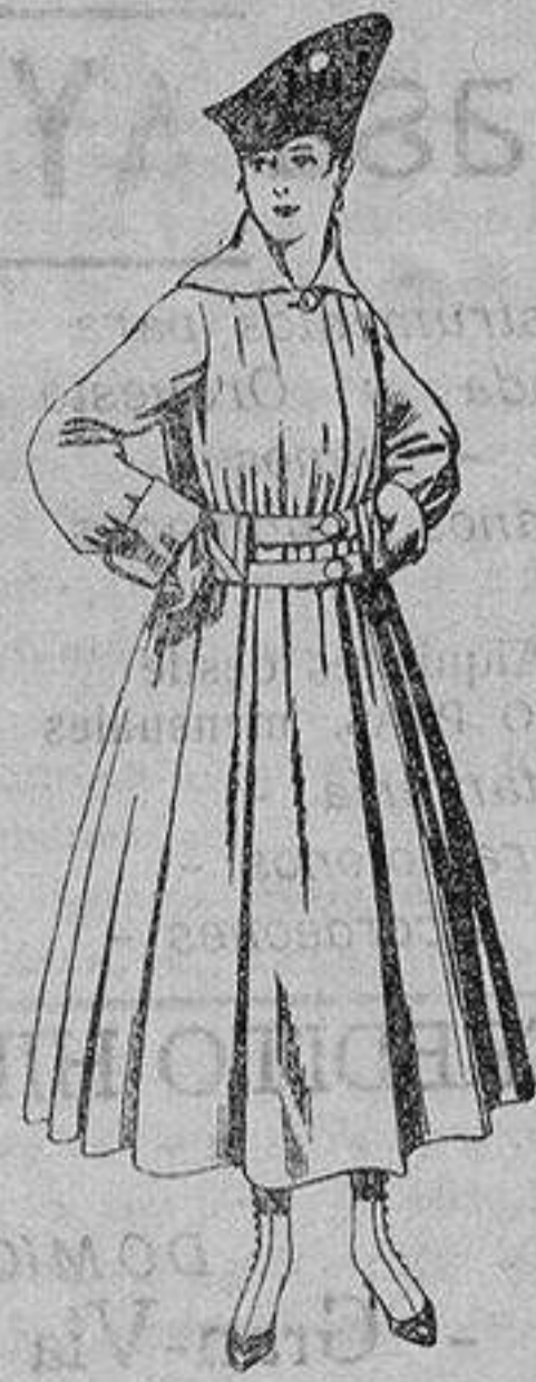
Abrigo de patén en color, para señora. De ptas. 50 a 60