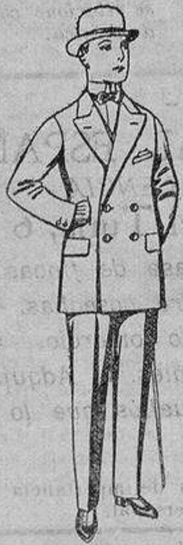
Trajes de patén vicuña o jerga, para niños de 10 a 12 años. De ptas. 23 a 45

Precio Fijo - Ventas al contado Pídase el Catálogo General