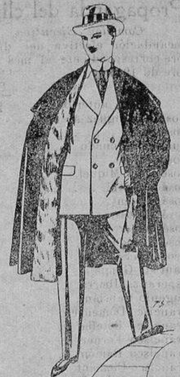
Capas (enteras) de paño de Béjar y Tarraza, embozos de peluche, terciopelo, astrakán o esocés. De ptas. 35 a 115