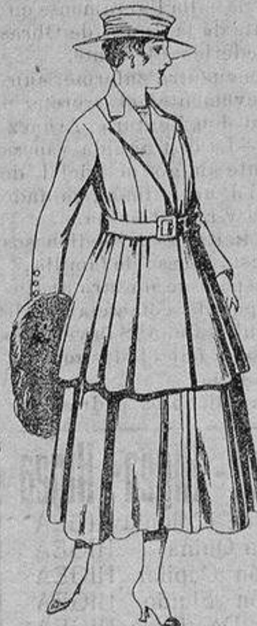
Traje de lana, para señora, en color negro y azul. De ptas. 85 a 100