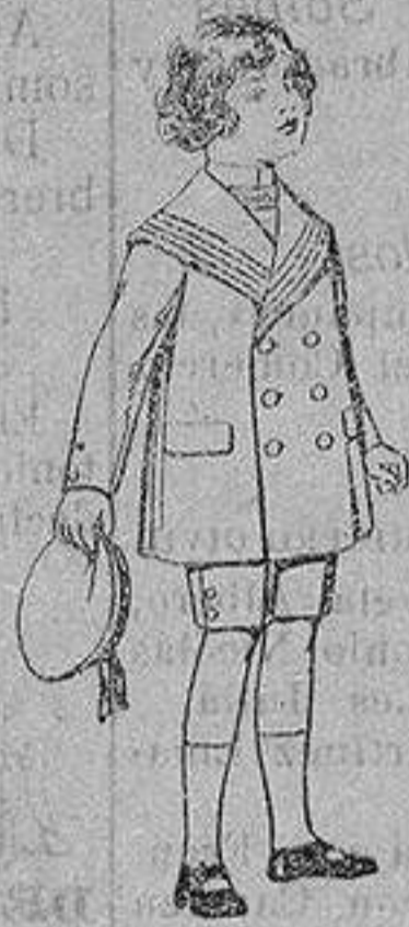
Trajes modelo matelot, de vicuña azul para niños de 4 a 9 años. De ptas. 12 a 31