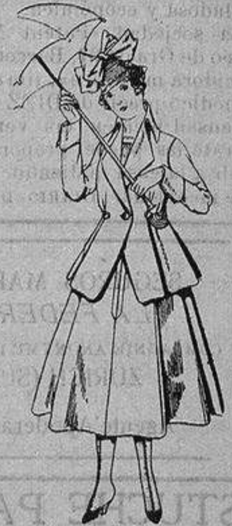
Trajes de lanilla negra azul y color, para jovencitas de 13 a 16 años. De ptas. 50 a 55

Camisería, Géneros de Punto, Corbatería, Guantería, Sombrerería, Zapatería, Paraguas, Bastones y Artículos de Viaje.