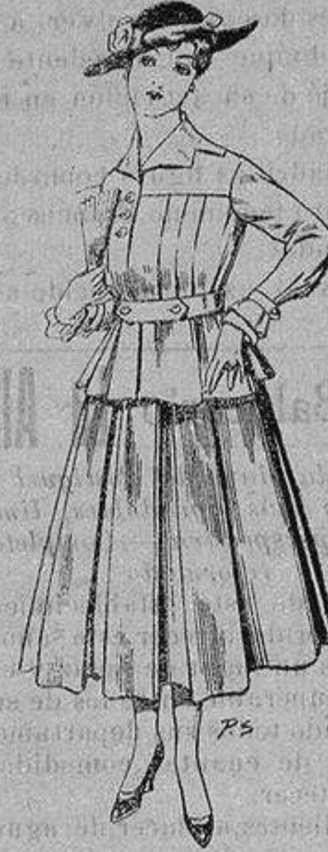
Trajes de lanilla negra azul y color, para señora. A ptas. 105