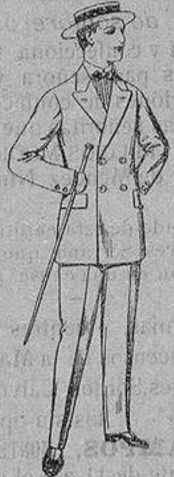
Trajes de lanilla, para jovencitos de 10 a 16 años. De ptas. 17 a 48