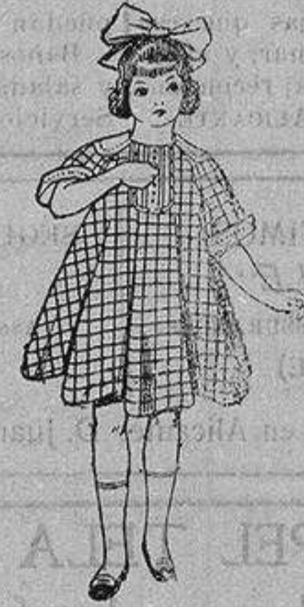
Trajes de lanilla para jovencitas de 13 a 16 años.