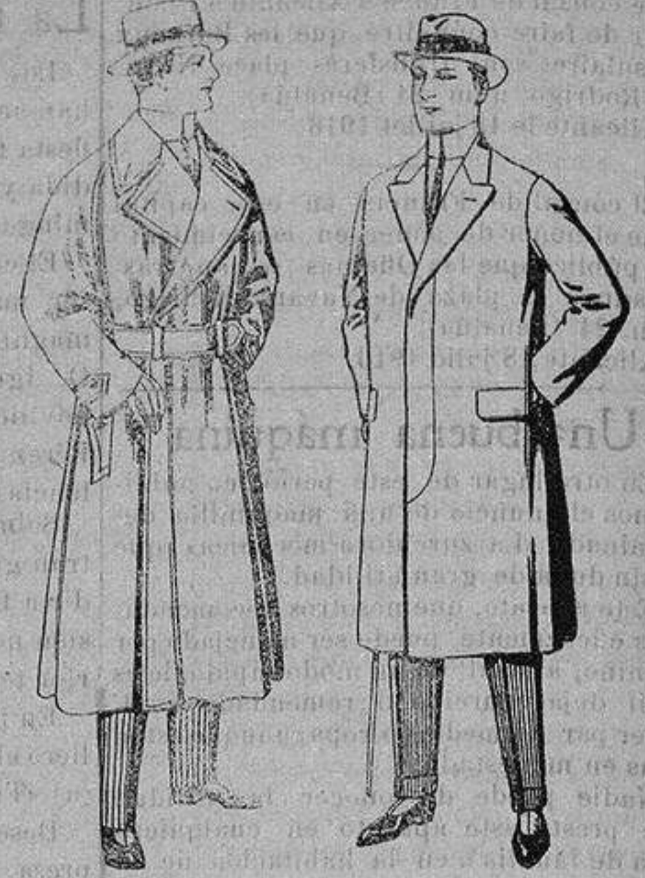
Gabanes impermeabilizados en color beige.

Madrid, Barcelona, Alicante, Almería, Bilbao, Cádiz, Cartagena, Gijón, Granada Málaga, Palma de Mallorca, Santander, Sevilla, Valencia, Valladolid y Zaragoza.