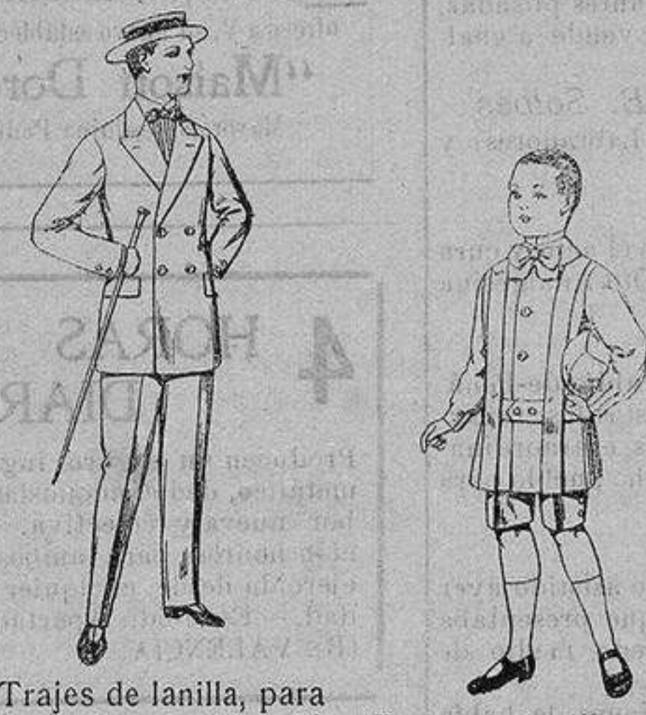
Trajes de lanilla, para jovencitos de 10 a 16 años. De ptas. 17 a 48 Trajes de lanilla para niños de 4 a 9 años De ptas. 12 a 31

Camisería, Géneros de Punto, Corbatería, Guantería, Sombrerería, Zapatería, Paraguas, Bastones y Artículos de Viaje.