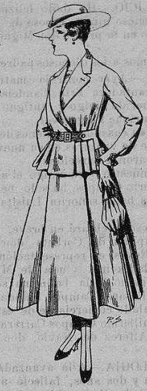
Trajes de lanilla para Señora A ptas. 70