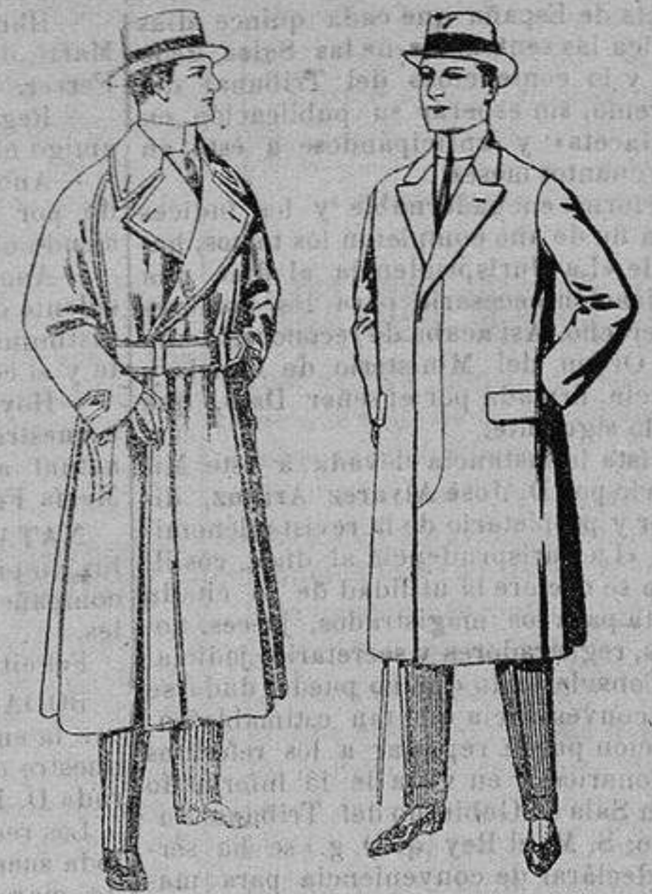
Gabanes impermeabilizados en color beige. De ptas. 65 a 110 Pardesus de melton o vigonia De ptas. 25 a 100