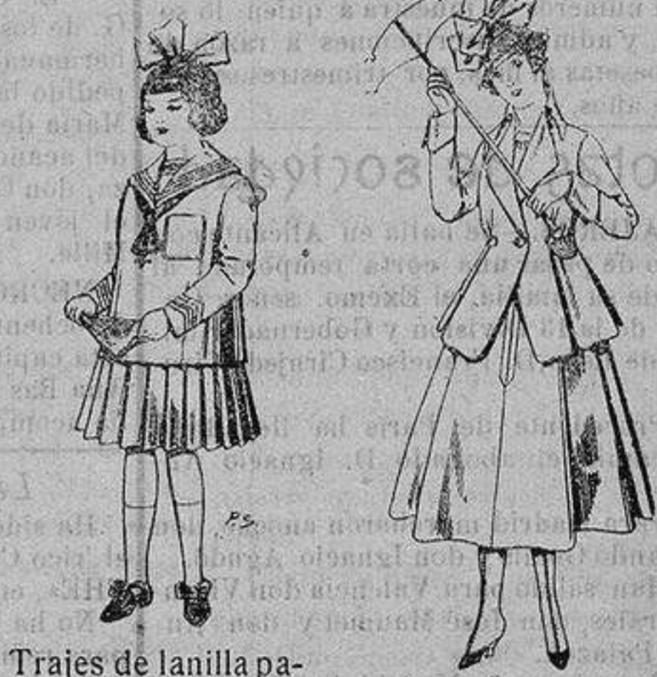
Trajes de lanilla para niñas de 4 a 12 años De ptas. 32 a 40 Trajes de lanilla para jovencitas de 13 a 16 años De ptas. 53 a 55