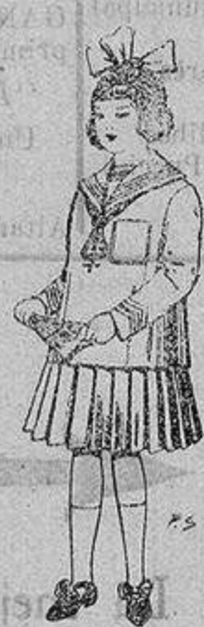
Trajes de lanilla para niñas de 4 a 12 años De ptas. 32 a 40