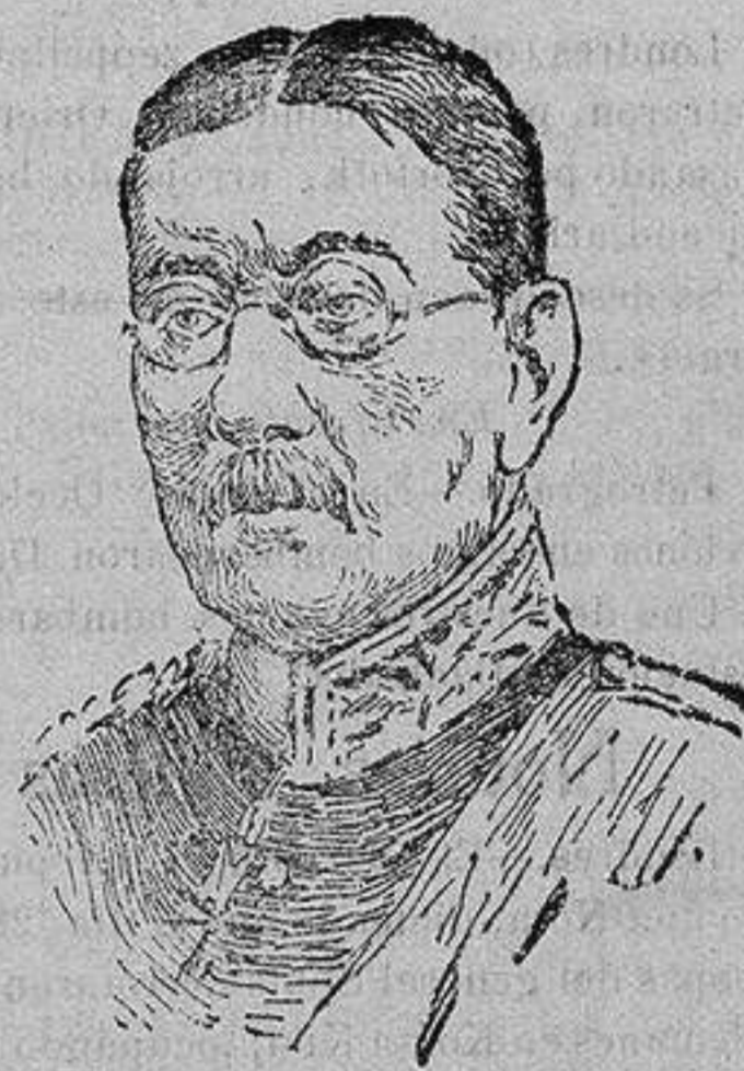
El mariscal alemán VAN DER GOLTZ que ha muerto en el cuartel general turco