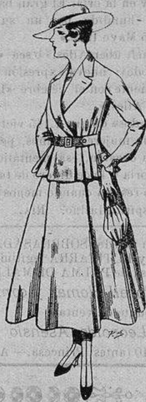
Trajes de lanilla para Señora A ptas. 70