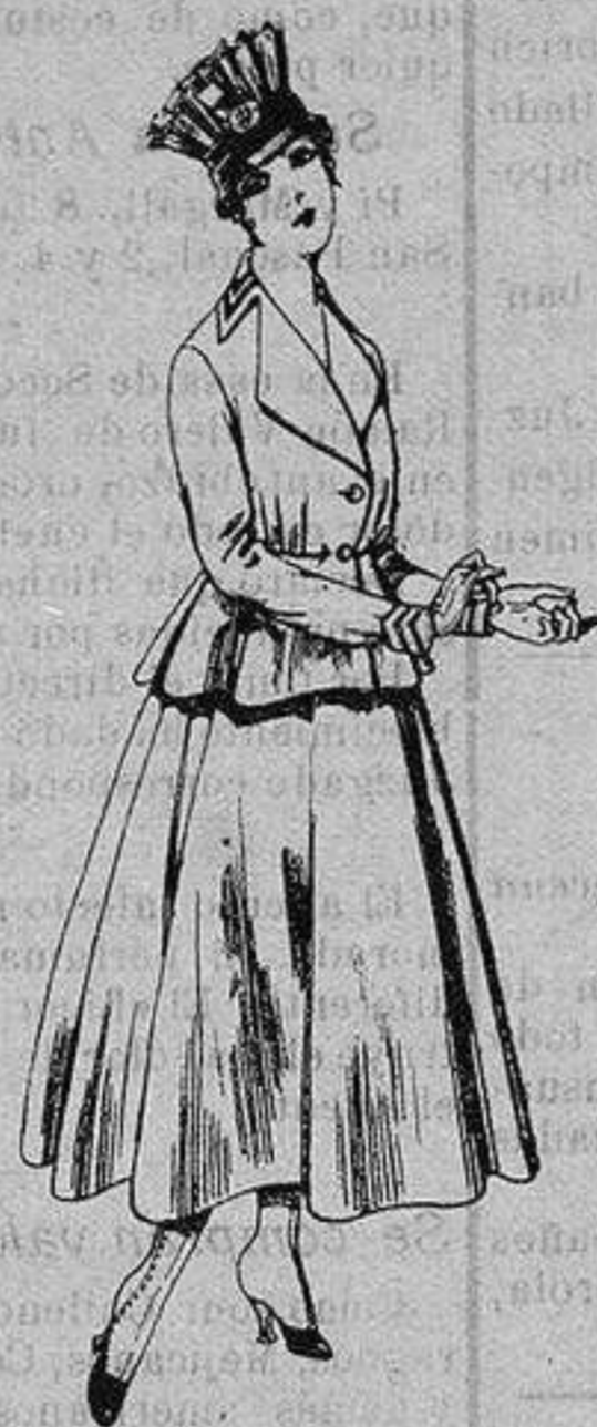
Trajes de lanilla para Señora A ptas. 80