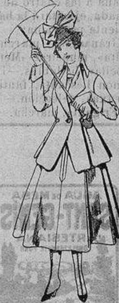
Trajes de lanilla para jovencitas de 13 a 16 años De ptas. 53 a 55

Camisería, Géneros de Punto, Corbatería, Guan- tería, Sombrerería, Zapatería, Paraguas, Basto- nes y Artículos de Viaje.