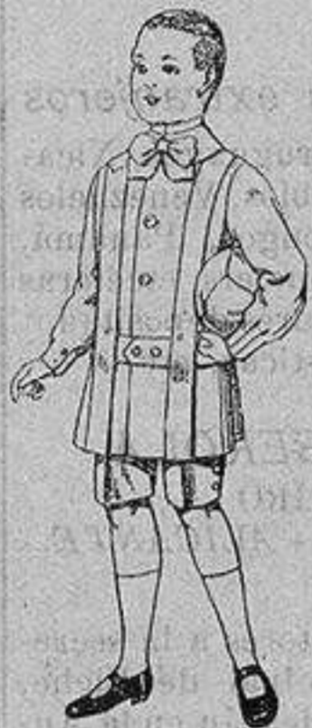
Trajes de lanilla para niños de 4 a 9 años De ptas. 12 a 31