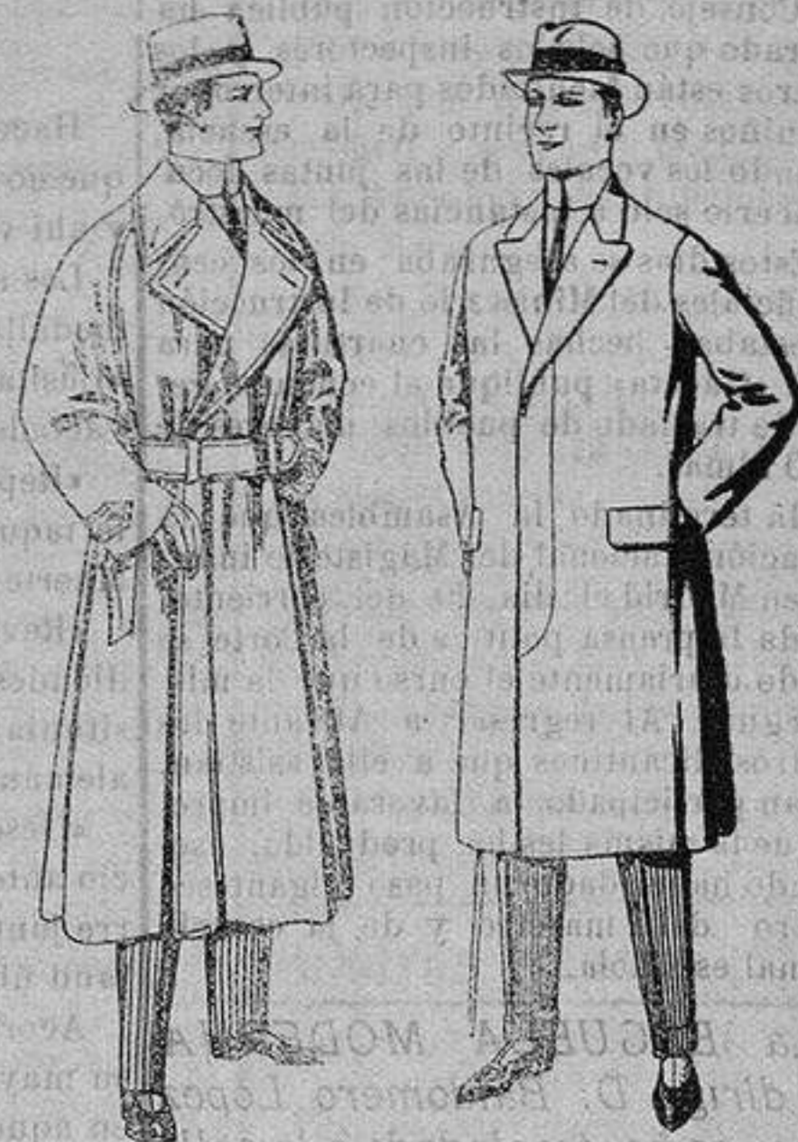
Gabanes impermea- bilizados en color beige. De ptas. 65 a 110 Pardesus de melton o vigonia De ptas. 25 a 100