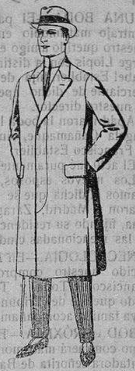
Gabanes impermeabilizados en color beige. De ptas. 65 a 110