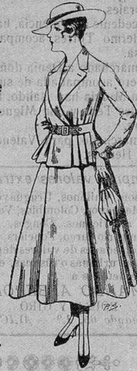
Trajes de lanilla para Señora A ptas. 70