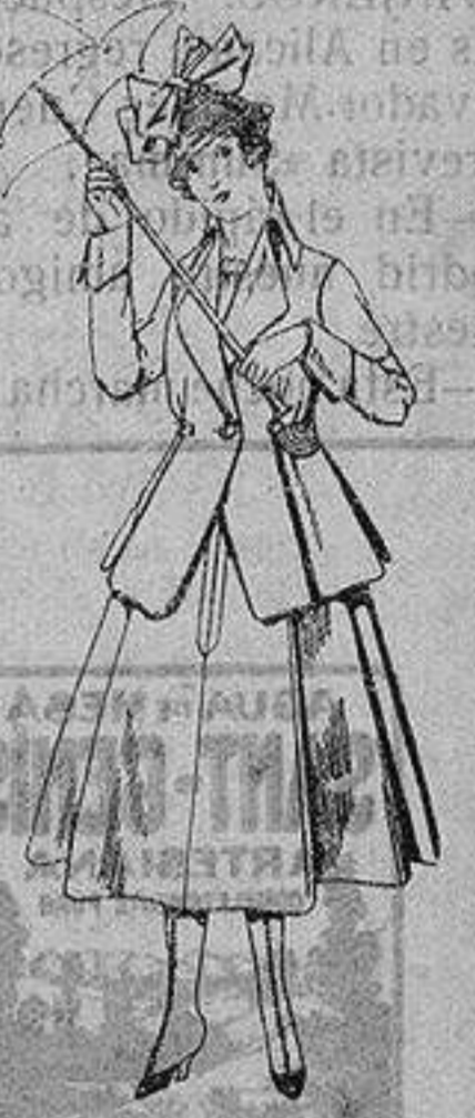
Trajes de lanilla para jovencitas de 13 a 16 años De ptas. 53 a 55

Camisería, Géneros de Punto, Corbatería, Guantería, Sombrerería, Zapatería, Paraguas, Bastones y Artículos de Viaje.