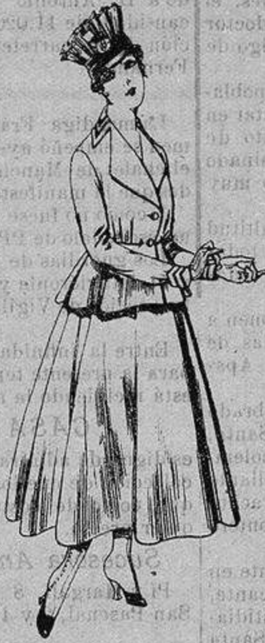
Trajes de lanilla para Señora A ptas. 80