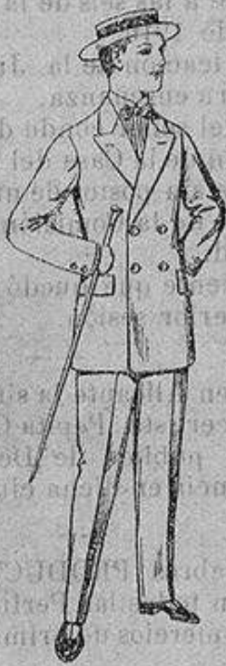
Trajes de lanilla, para jovencitos de 10 a 16 años. De ptas. 17 a 48