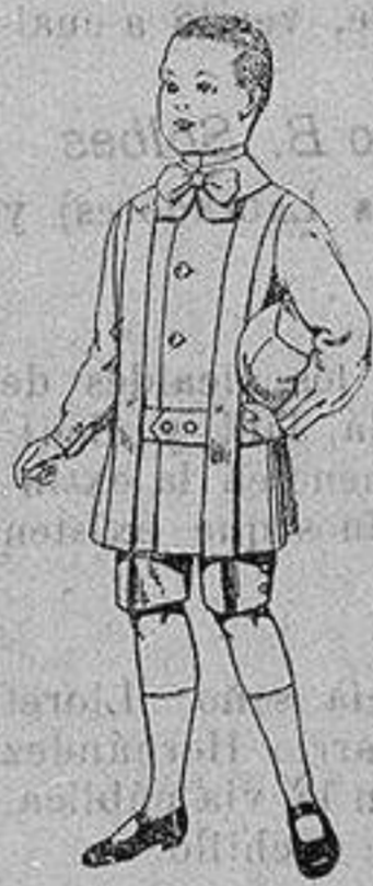
Trajes de lanilla para niños de 4 a 9 años De ptas. 12 a 31