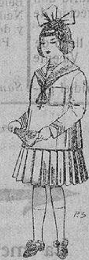
Trajes de lanilla para niñas de 4 a 12 años De ptas. 32 a 40