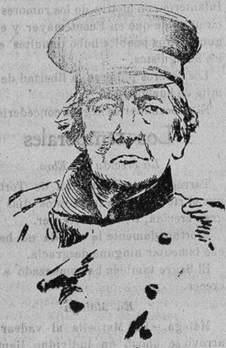
El general conde von HAESELER a quien se indica como director de los ataques de los alemanes contra las defensas de Verdun

nocer que la batalla de Verdun no hará modificar los acuerdos probablemente fijados por el Comité Internacional de Guerra.