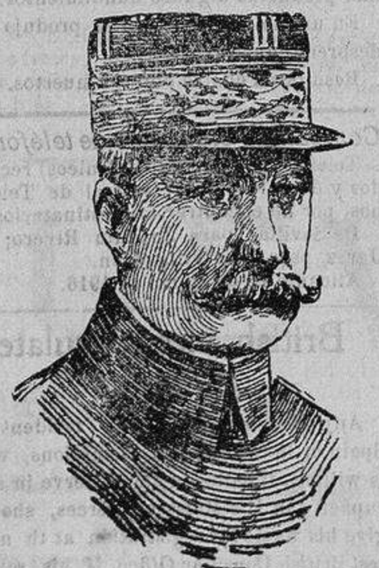
El general PATAIN comandante en jefe del ejército francés, defensor de Verdun

Hecho conocido: los alemanes, a pesar de sus heroicos esfuerzos delante de Ver-