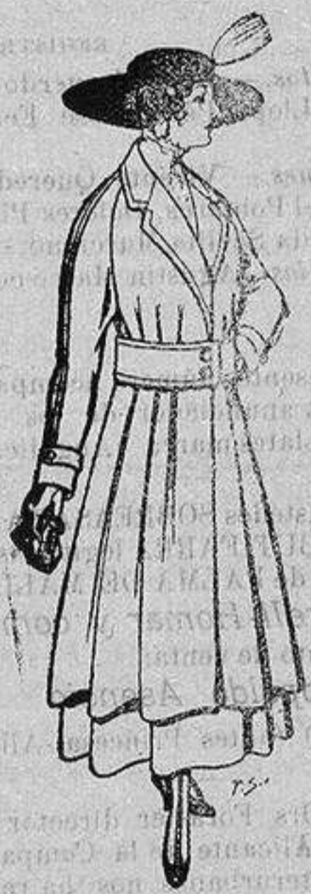
Abrigos de patén gran novedad para señora A ptas. 53

Ropas confeccionadas para Caballero, Señora, Niño y Niña