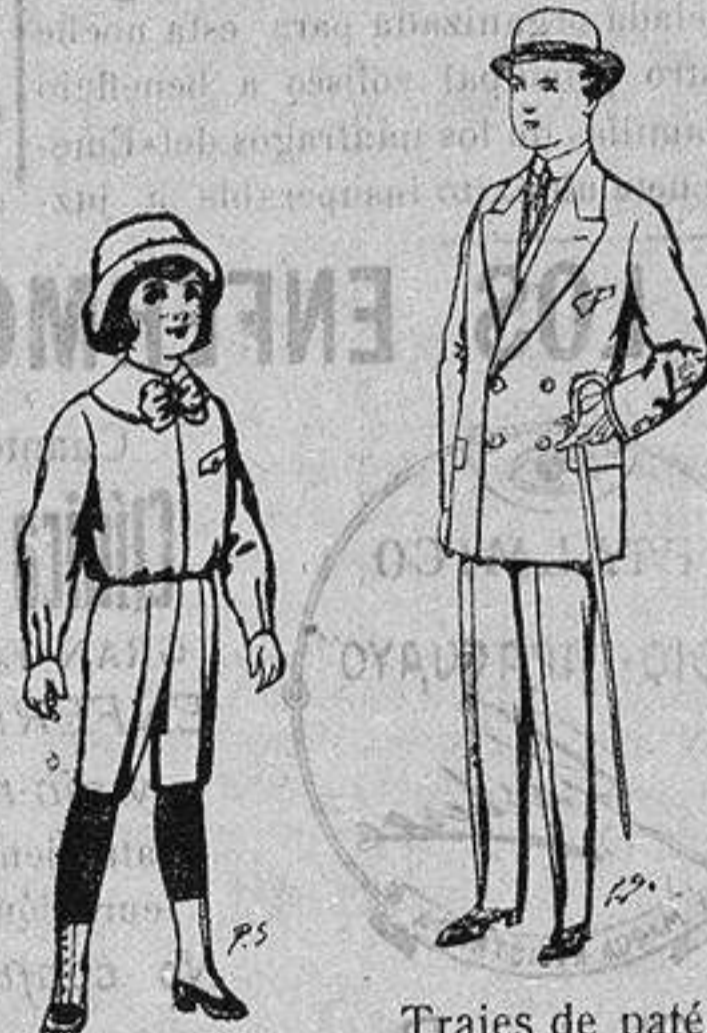
Trajes de paté para niños de 4 a 9 años De ptas. 5 a 7'50 Trajes de patén, vicuña, etc., para niños de 10 a 16 años De ptas. 25 a 48