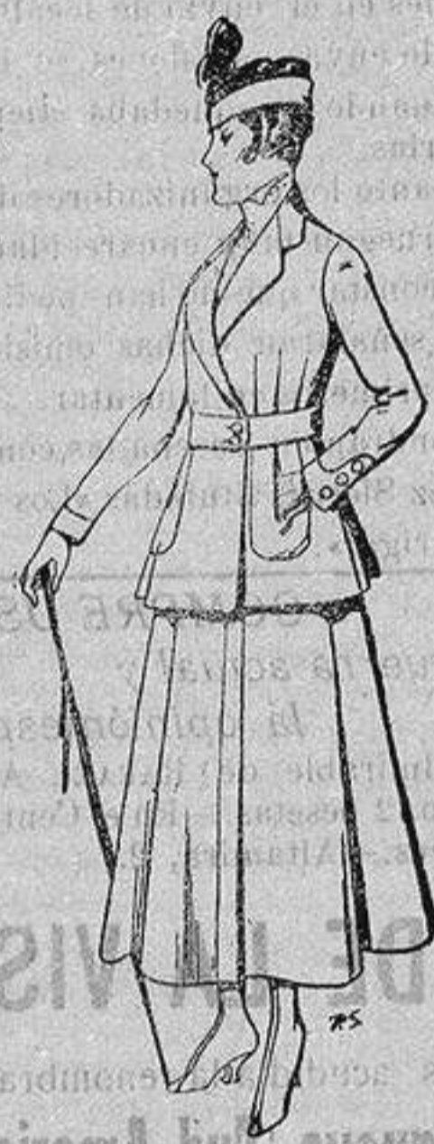
Trajes de lana negra azul y color, para señora De ptas. 50 a 55

Peletería, Camisería, Generos de Punto, Corbatería, Guantería, Sombrerería, Zapatería, Paraguas, Bastones y Artículos de Viaje.