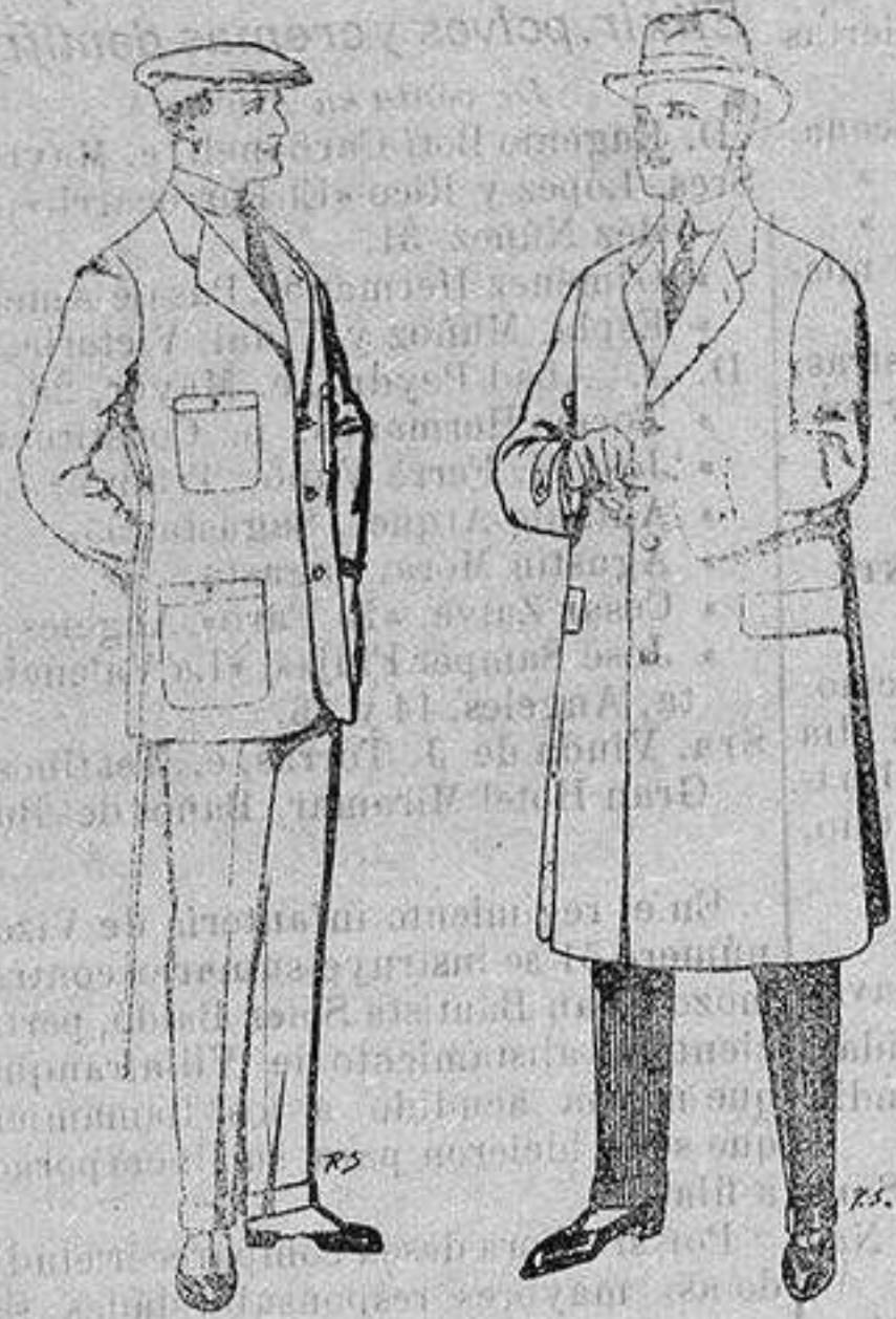
Trajes de cheviot corte elegante para "Sportman" De 35 a 50 ptas Gabanés de tejido pluma o satina De ptas. 30 a 100

Madrid, Barcelona, Alicante, Almería, Bilbao, Cádiz, Cartagena, Gijón, Granada, Málaga, Palma de Mallorca, Santander, Sevilla, Valencia, Valladolid y Zaragoza