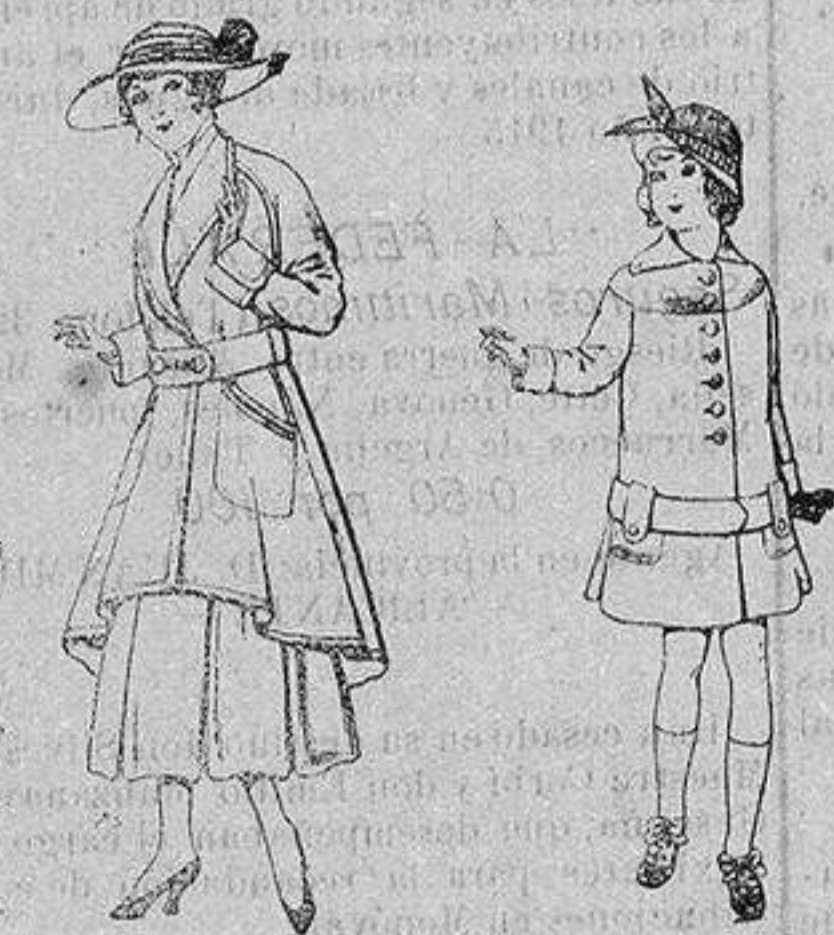
Abrigos de patén para jovencitas de 13 a 16 años De ptas. 25 a 35 Abrigos de patén para niños de 4 a 12 años De ptas. 15 a 25