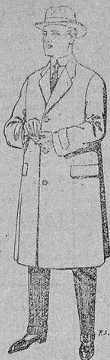
Gabanes de tejido pluma o satina De ptas. 30 a 100