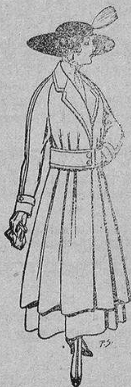
Abrigos de patén gran novedad para señora A ptas. 53