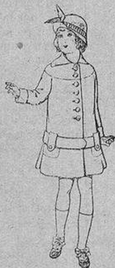
Abrigos de patén para niños de 4 a 12 años De ptas. 15 a 25