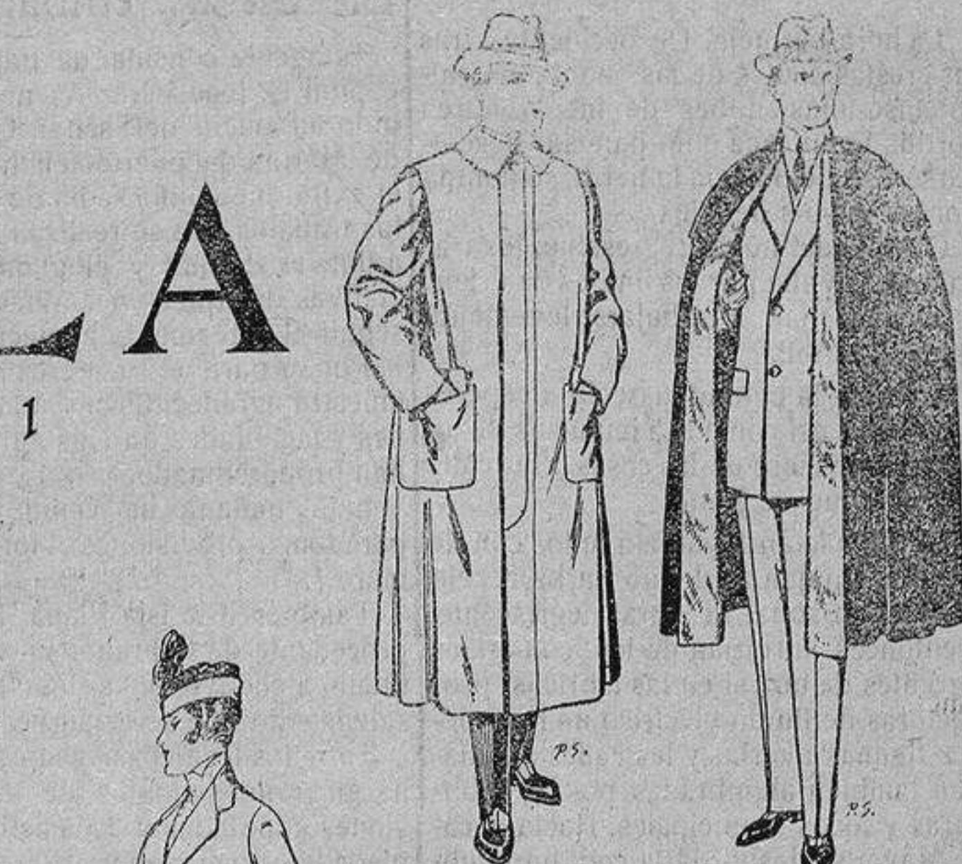
Impermeables forma gabán en color beige o gris De ptas. 35 a 100