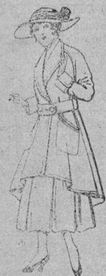
Abrigos de patén para jovencitas de 13 a 16 años De ptas. 25 a 35