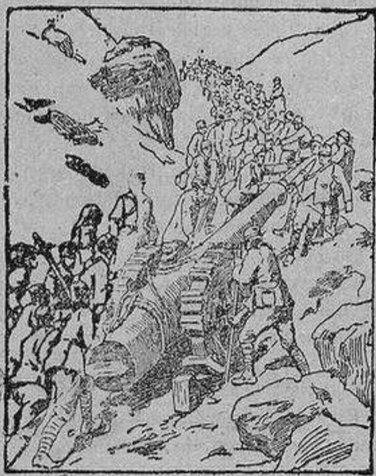
Tropas italianas subiendo un cañón de grueso calibre a una elevada posición.