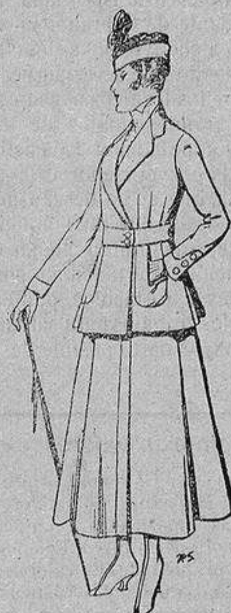
Trajes de lana negra azul y color, para señora De ptas. 50 a 55