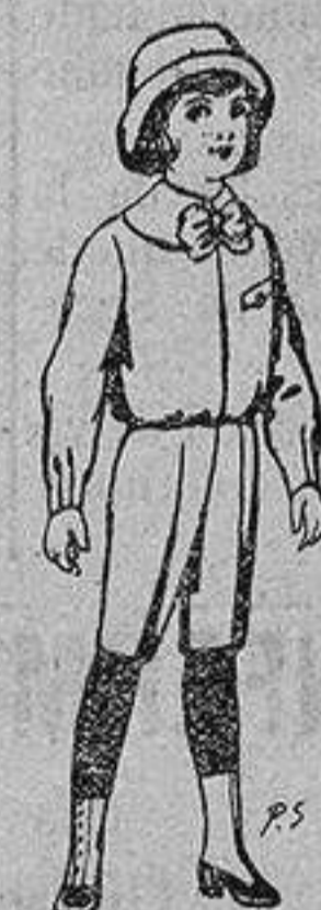
Trajes de patén para niños de 4 a 9 años De ptas. 5 a 7'50