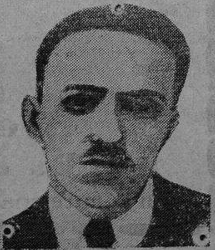
Francisco Ascaso Abadía, pistolero fugitivo

Como las características del asalto eran idénticas a las empleadas por los pistoleros en el Hospital Rawson, la Policía uruguaya comenzó sus pesquisas tan intensamente, que en la madrugada del día 16 de noviembre logró darse con el refugio de los fugitivos, sito en una casita aislada en la calle de Rousseau, en el barrio de la Unión, una especie de Cuatro Caminos o Tetuán de las Victorias en Madrid.