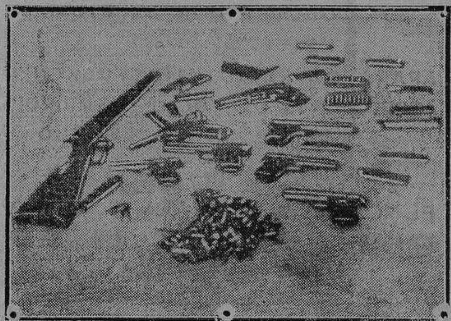
Armas y municiones cogidas a los pistoleros

Todos los detenidos, convictos y confesos del asalto a la Banca Mes-