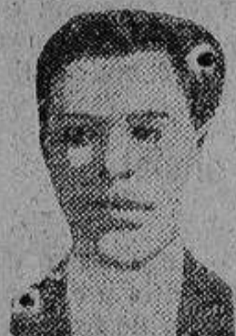
Buenaventura Durruti Domínguez fugitivo

Un cerco trágico.---Emocionante captura de seis pistoleros. --- Suicidio de uno de los jefes.---El cabecilla Roscigna y los famosos Asco y Durruti, fugitivos