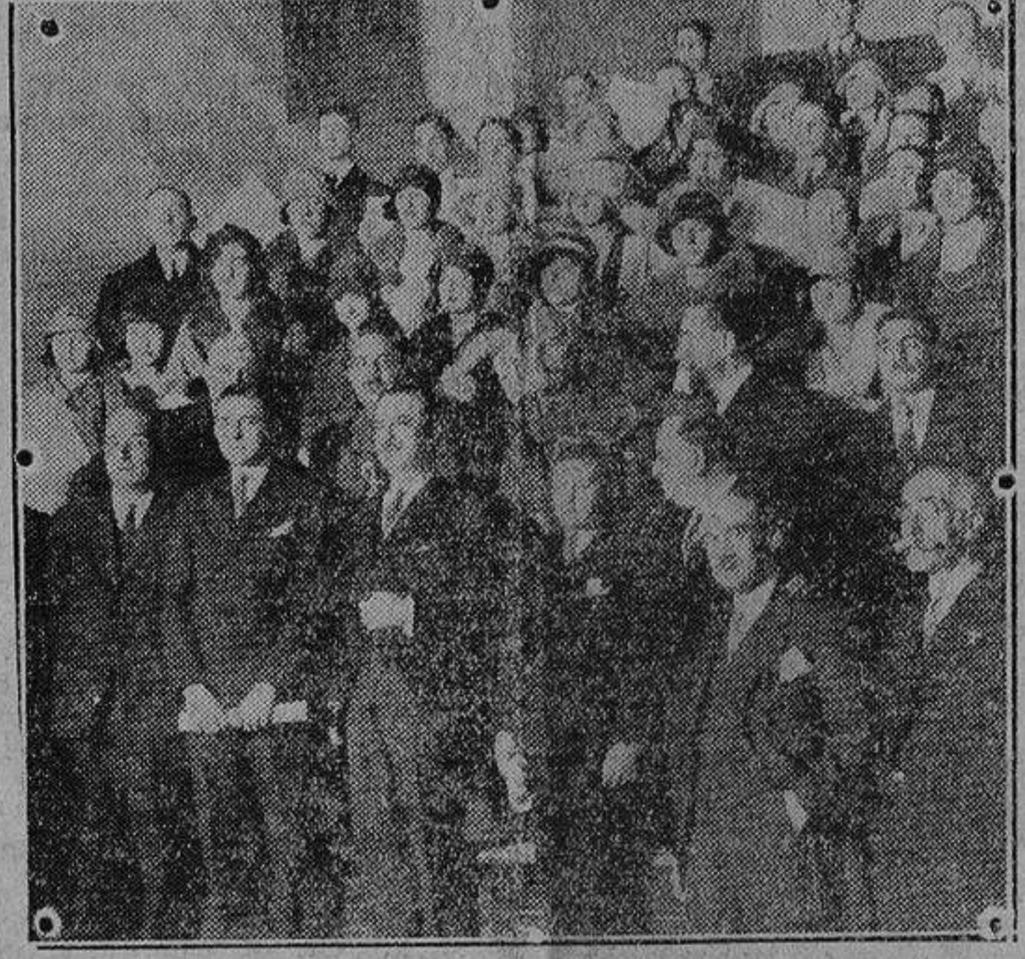
Los Infantes D. Juan y D. Gonzalo, con sus profesores y el rector de la universidad, después de recibir el título de bachiller, que les fué entregado ayer en el Instituto de San Isidro, acompañados de los demás alumnos, a los que igualmente se distribuyeron los títulos y premios de último curso.