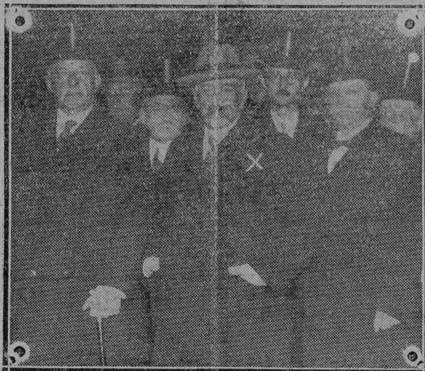
El ministro de Marina francés Mr. Leygues (x), a la llegada a Madrid

La Escuela de Altos Estudios Hispánicos es una realidad perfectamente lograda y manifestada en interesantes publicaciones, que forman una pequeña y selecta biblio-