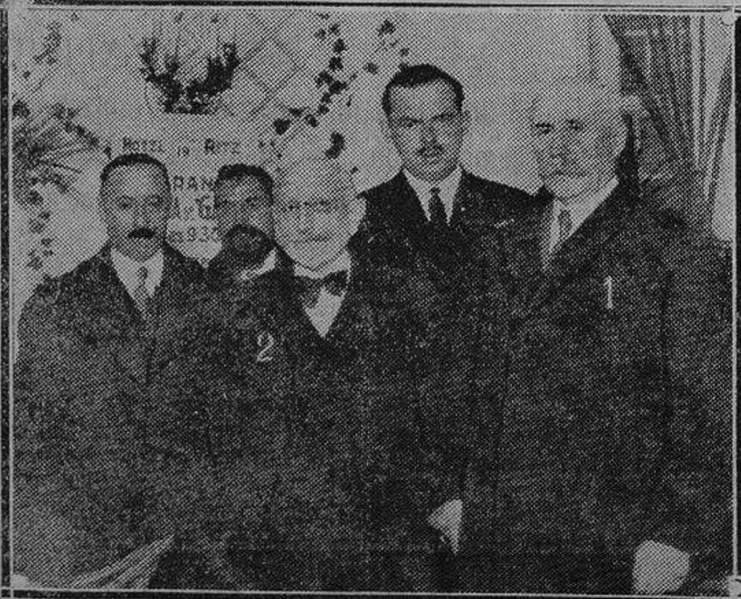
El mariscal Petain y el almirante Lacaze que asistieron al acto inaugural