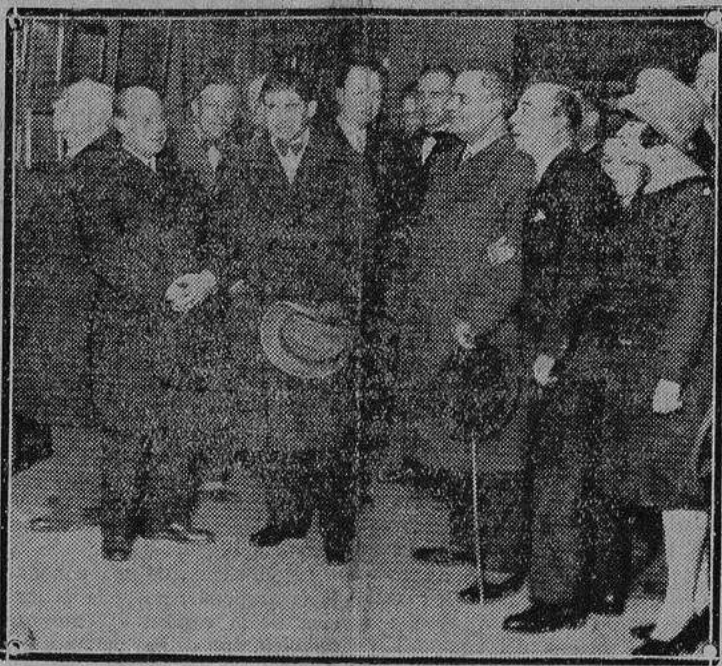
Concurrentes a la inauguración de la Exposición de marinas y paisajes del pintor Ricardo Verdugo Land.