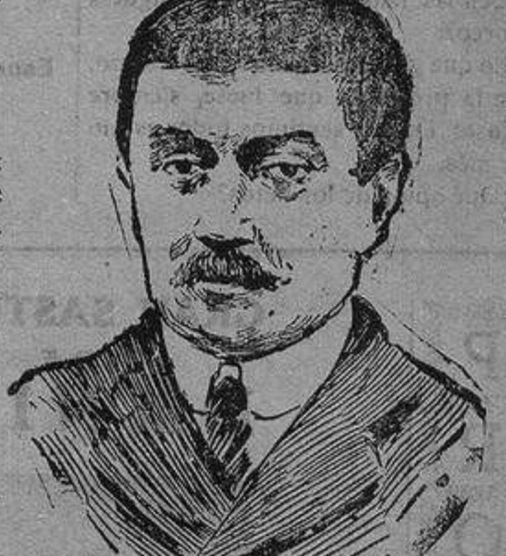
M. Painlevé que se encuentra en Ginebra presidiendo el Consejo de Administrador del Instituto de Cooperación Intelectual