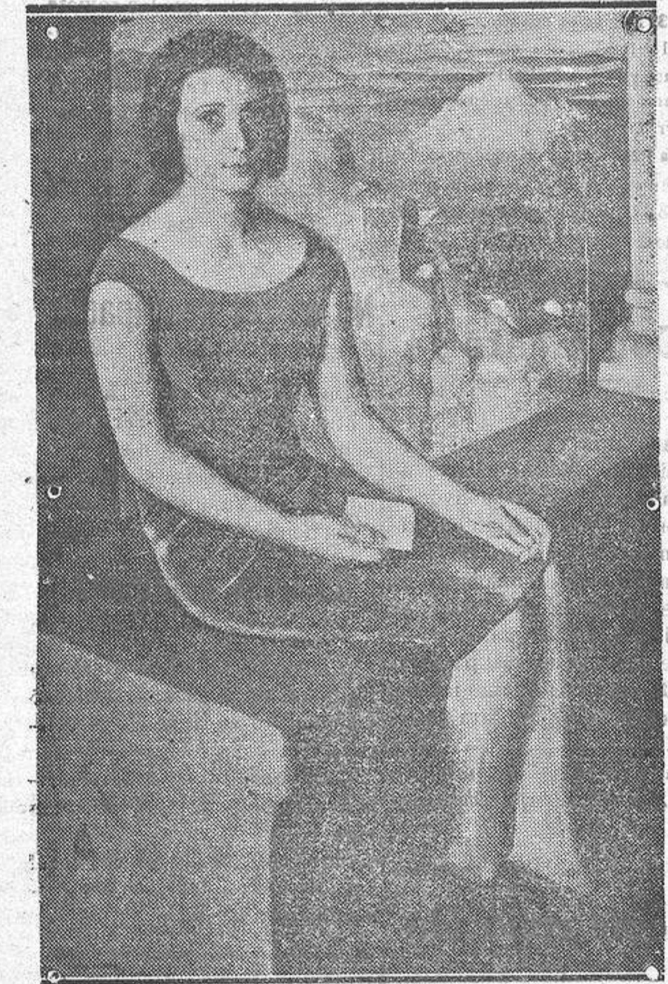
«Retrato», por Eugenio Hermoso.

to tanto empeño en adularlo con en- fadosas sportsiones forasteras.