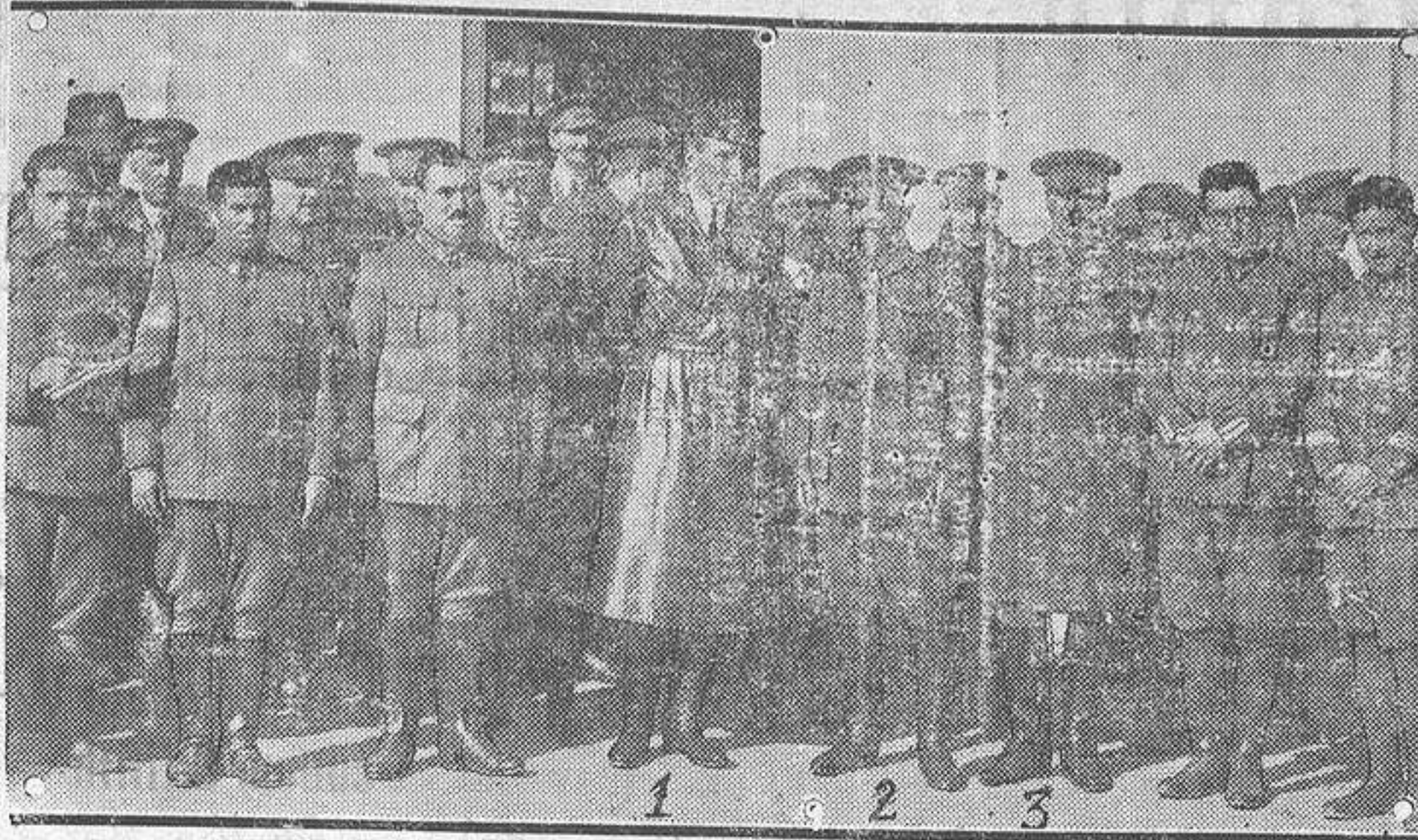
Su Alteza el Infante D. Alfonso (1) con el barón de Casa Davalillo (2), el general Saro (3) y varios jefes y oficiales, al salir de la inauguración del Casino de Clases instalado en el campamento de Carabanchel.