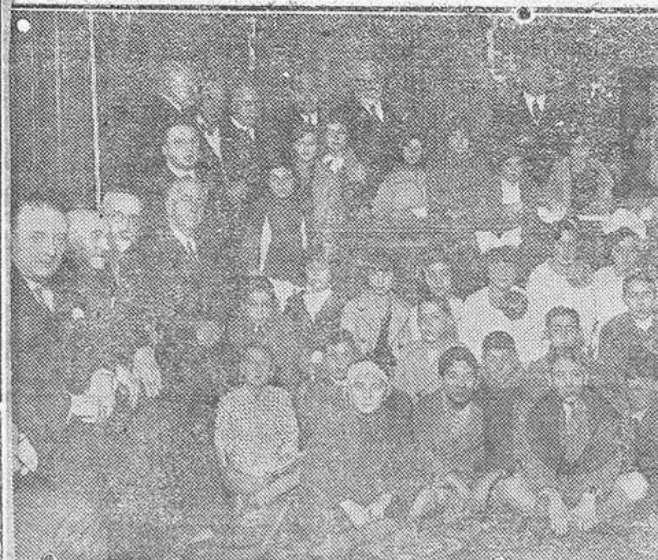
Grupo de niños de doce años, hijos de industriales, a los que repartió la Cámara de la Industria de Madrid cartillas del Monte de Piedad en conmemoración de la Fiesta de la Raza.