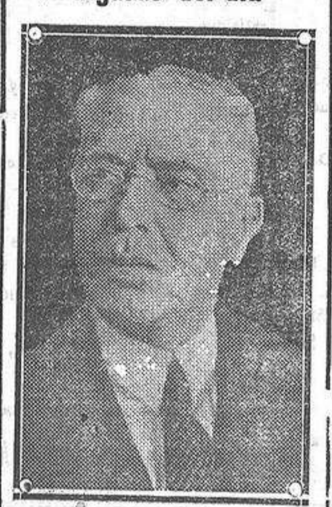
D. Pascual Ortiz Rubio candidato del partido nacional revolucionario que ha sido elegido presidente de Méjico