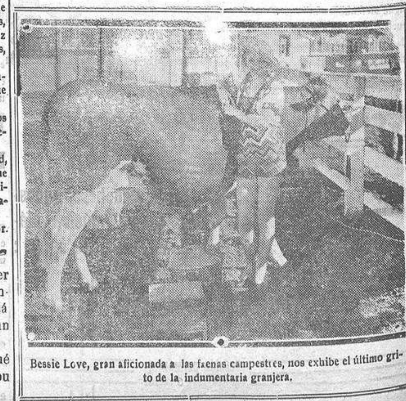
Bessie Love, gran aficionada a las faenas campestres, nos exhibe el último grieto de la indumentaria granjera.

Además de todo esto, se necesitaron 40 hombres y una orquesta completa por 80 profesores, para la sincronización musical.