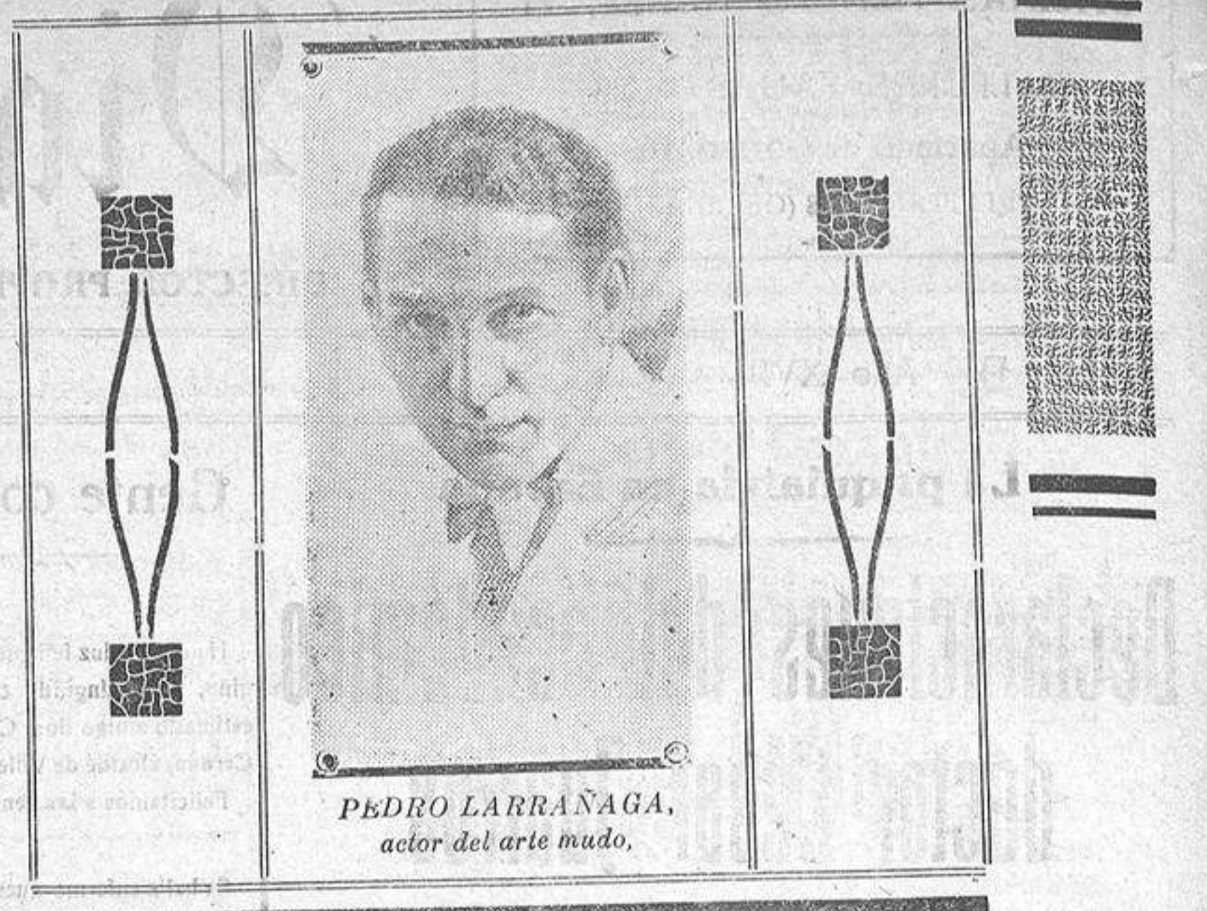
PEDRO LARRAÑAGA, actor del arte mudo.