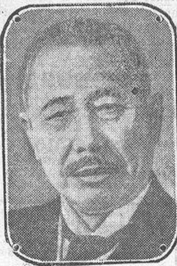
El Barón Tanaka, expresidente del Consejo de ministros del Japón, que acaba de fallecer.