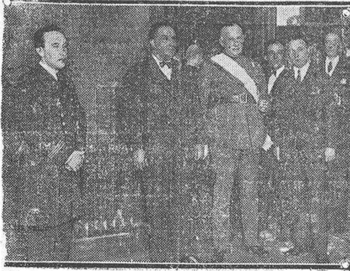
El general Primo de Rivera, después de ser impuesto en la Embajada de Chile la banda de la Orden del Mérito.