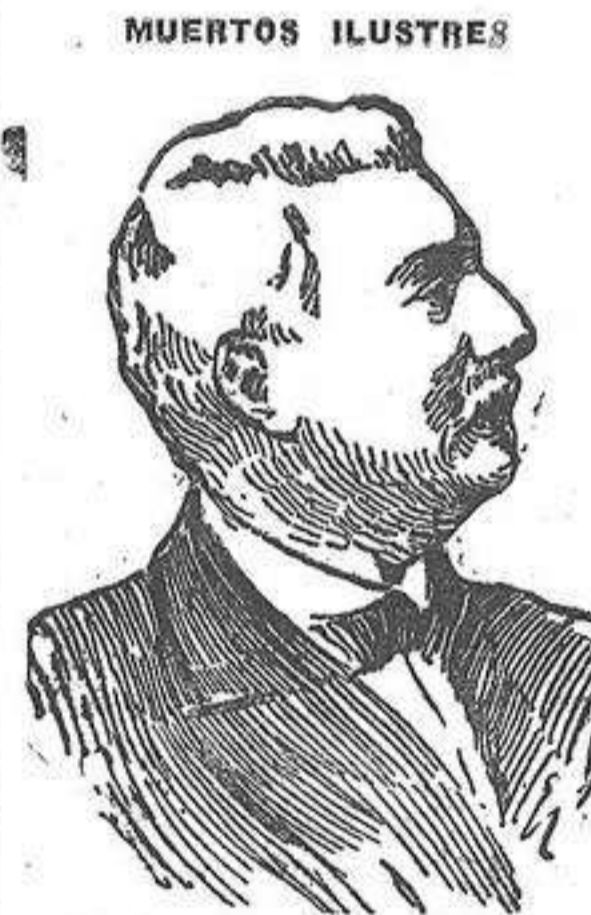
Monsieur Ernesto Monis, ex jefe de Gobierno francés que a los ochenta y tres años de edad ha fallecido en Burdeos, donde residía.

Dos explanadas soberbias sombreadas por viejos y jóvenes árboles, divinamente aseQUIbles a los autos por una hermosa carretera recién construida, ofrecen al visitante agua fresquísima y limpia, como el tesoro mas preciado, y luego hermosas escalinatas pétreas que dan un aspecto de parque señorial al pintoresco rincón, magníficas grutas, tanto naturales como artificiales, que ofrecen limpias aguas y dulcísimo frescor al sudoroso excursionista; gandes y numerosas mesas de piedra rodeadas asimismo de bancos y sillas, cómodos fogones para leña en una ancha cocina rústica, rumorosas boquecillos y jóvenes pinadas, conjunto tal de comodidades y alicientes que hacen de este lugar uno de los mas amenos y económicos de la región máxime si se tiene en cuenta el