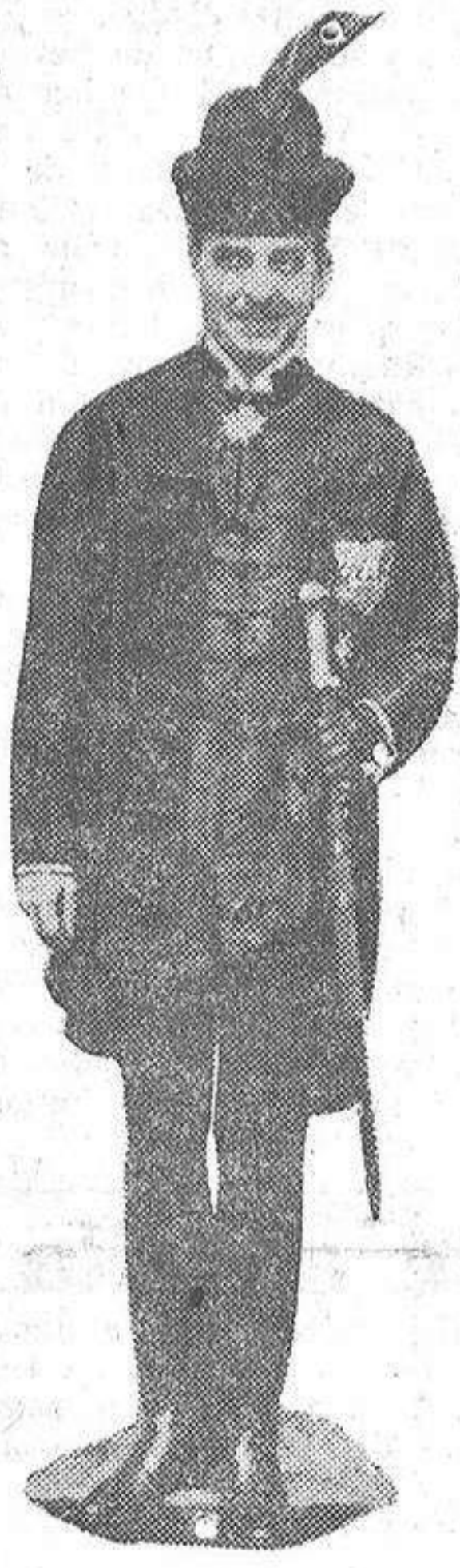
Monsieur Pierre de Matuska, ministro de Hungría en España, que ayer presentó sus cartas credenciales a Su Majestad