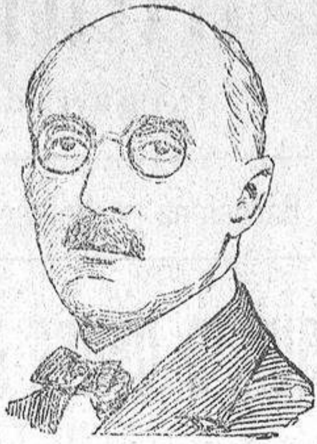
Don Eusebio de Gorbea, distinguido escritor al que la Academia Española ha concedido el premio Fanstenrath, por su drama «Los que no perdonan».