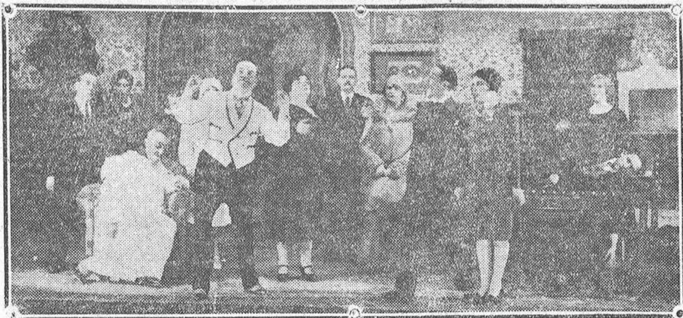
Una de las más interesantes escenas de la obra «¿Qué tienes en la mirada?» estrenada en el teatro de la Comedia de Madrid recientemente