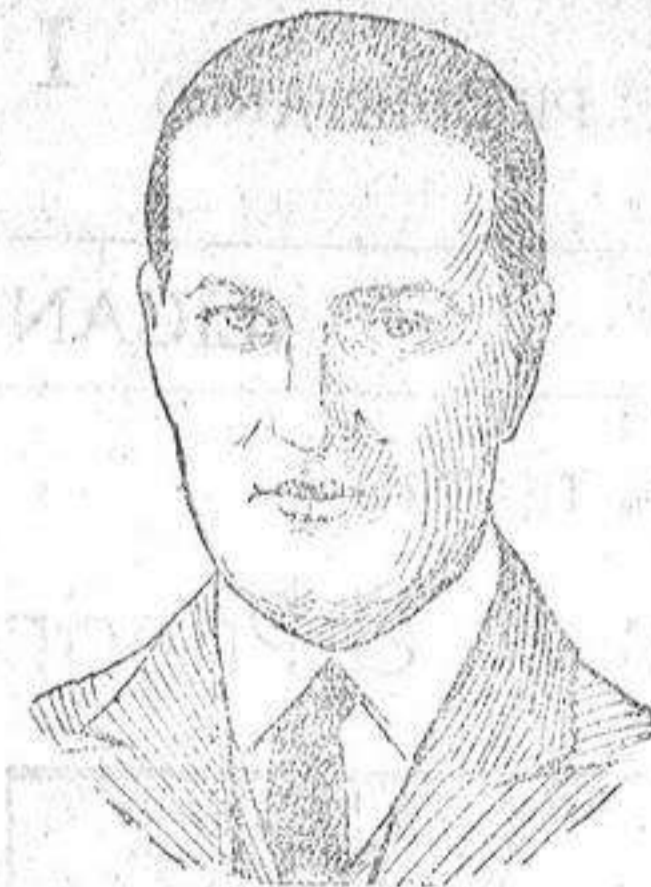
El conde Zamoyksi Borbón Sicilia, que en la Capilla Real ha contraído matrimonio con la infanta Isabel Alfonso esta mañana.

Anoche se celebró en Palacio una comida íntima a la que asistieron