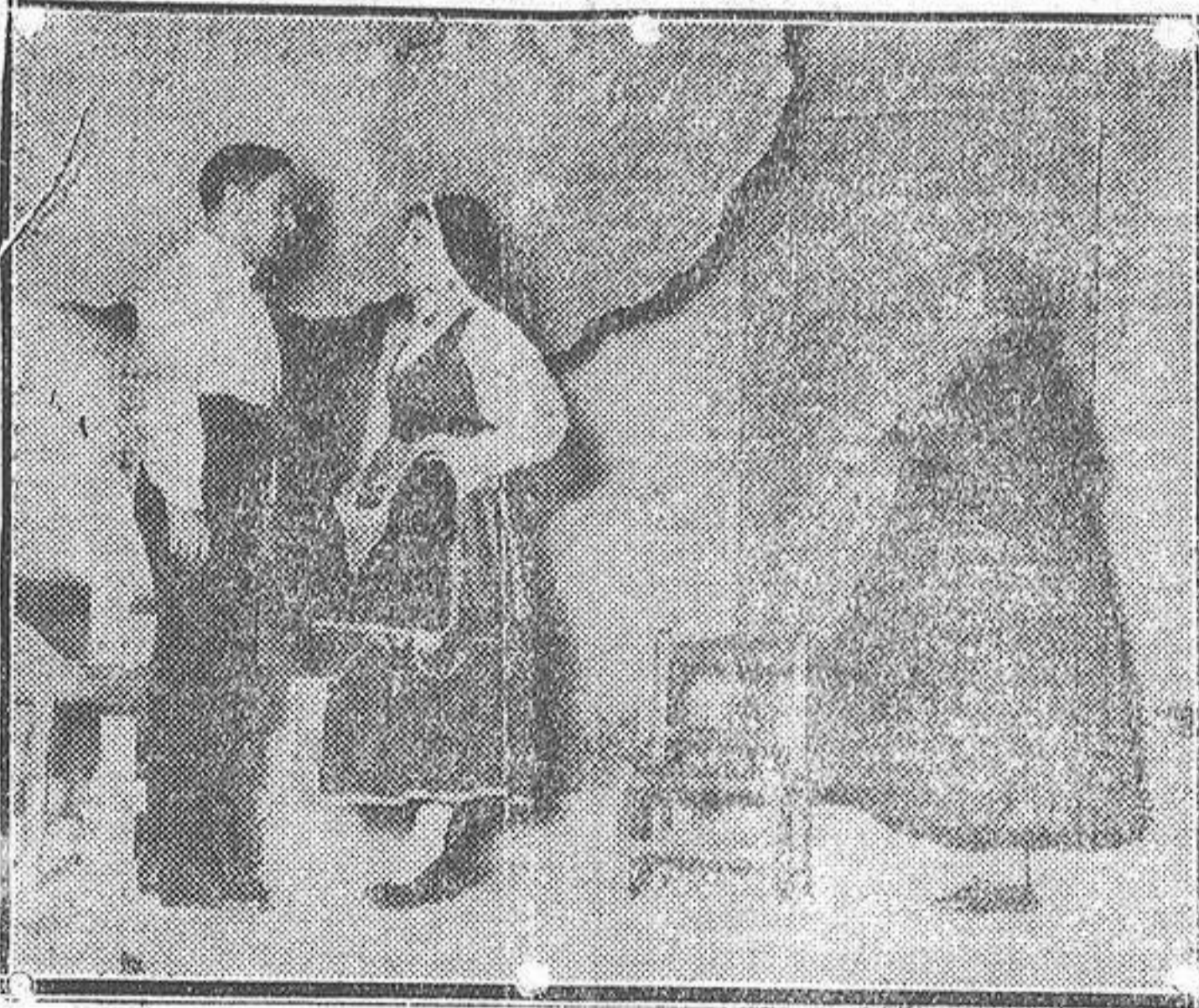
Una escena de «Cuento de aldeas», estrenada en el teatro Reina Victoria, de Madrid.

mento de subvención para la Escuela del Trabajo.