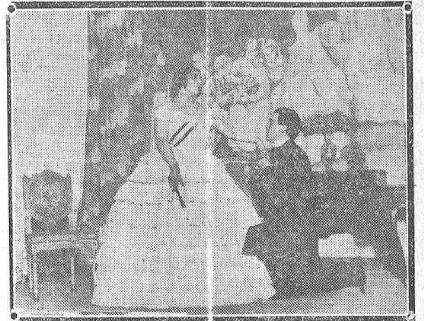
Una escena de la comedia «Romance», estrenada anoche con ru-doso éxito por Lola Membrives, en el teatro del Centro.