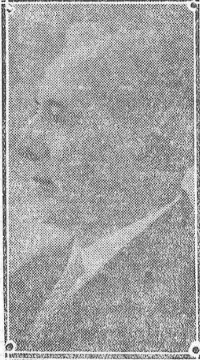
El bajo Mardones

La Zarzuela presentaba en este último concierto, un aspecto grandioso, esa multitud ávida de admirar el verdadero arte, se apiñaba en todas las localidades de este hermoso teatro.