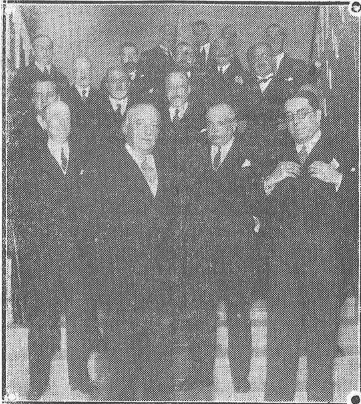
El jefe con los ministros de Gracia y Justicia e Instrucción Pública y otras personalidades que concurrieron ayer tarde, en la Academia de Jurisprudencia, al acto inaugural del curso de conferencias organizado por la Asociación Española de Derecho Internacional y Legislación Comparada.