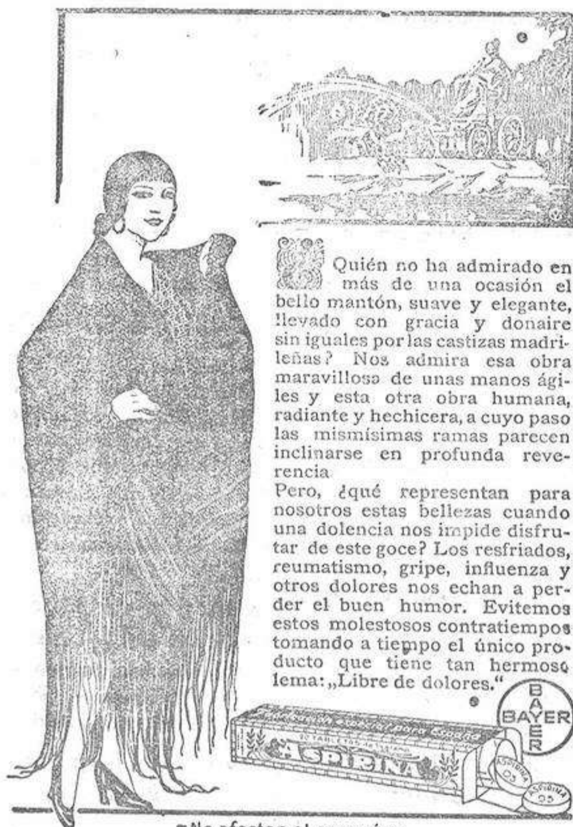
—No afectan al corazón—

El público respondió a este servicio llenando totalmente los coches.