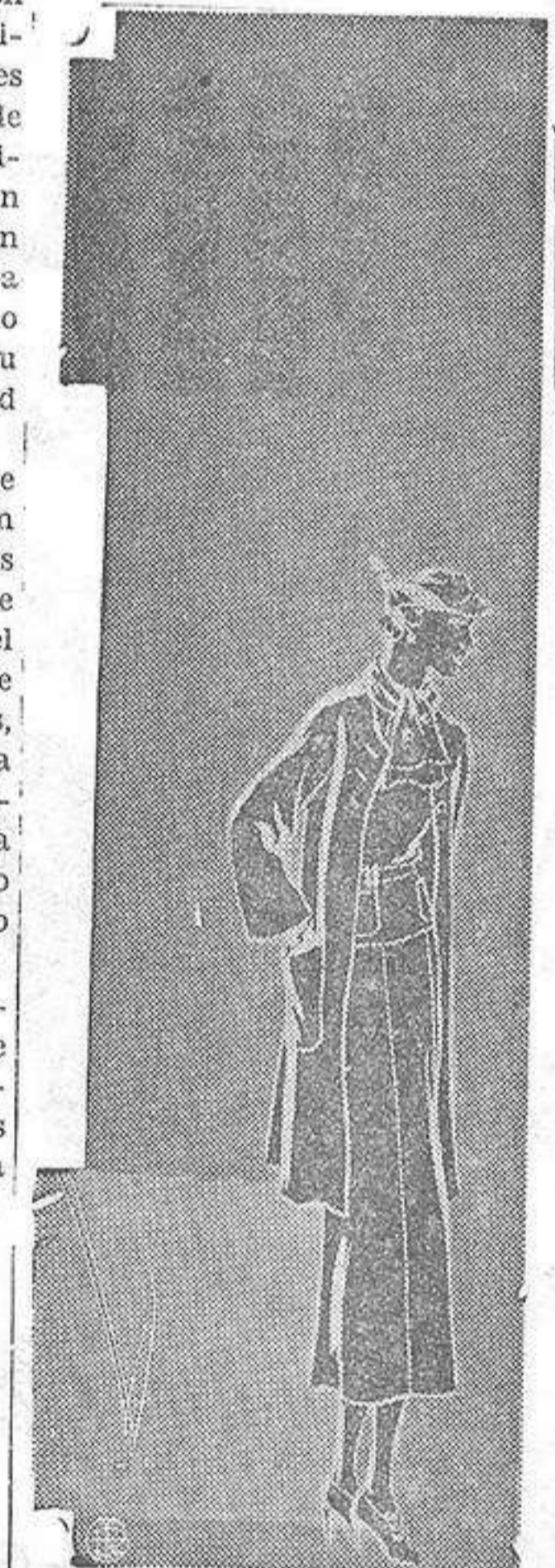
CONJUNTO PARA CALLE

Hasta las cuatro de la madrugada se admiten órdenes de inscripción de esuelas funerarias, en nuestros talleres, instalados en la calle Mestre Martínez, 10 (antes Infanta).