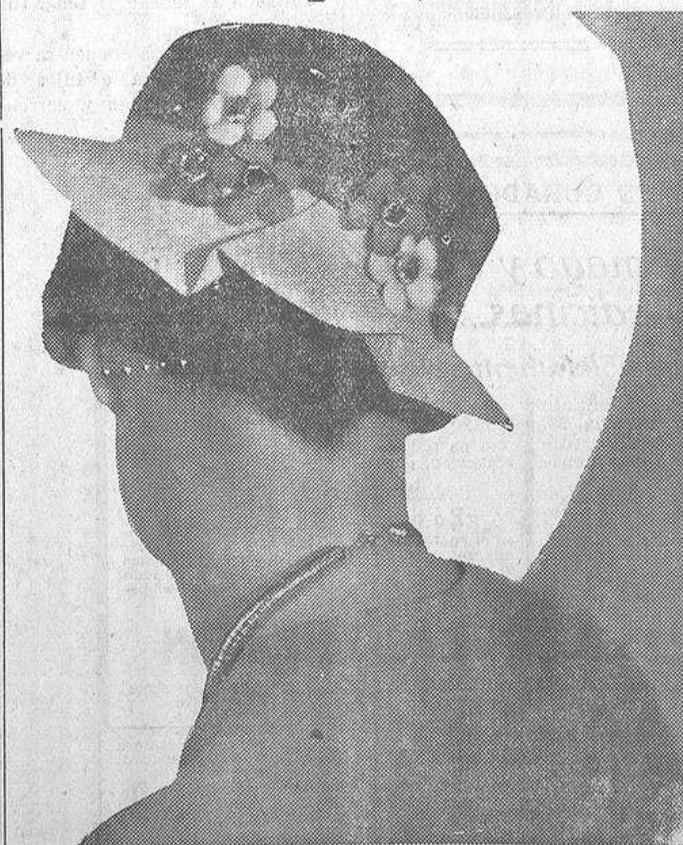
Modelo de sombrero que está teniendo gran aceptación en la presente temporada.