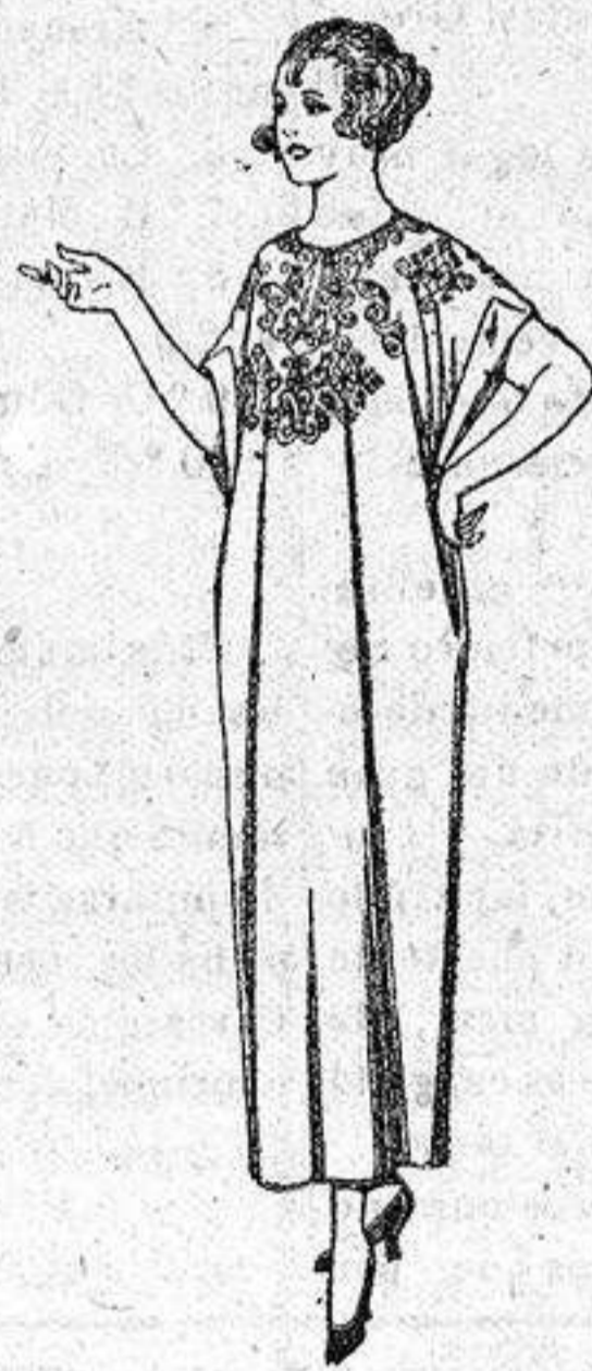
Batas de crespón, voile, etc., adornos bordados, de ptas. 14 a 22