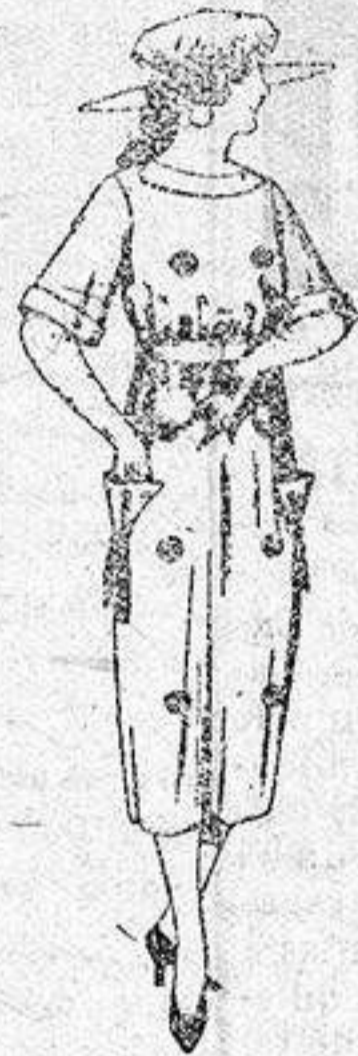
Vestidos de sarga inglesa, estambre, etc., en azul y colores, adornos bordados, de ptas. 55 a 62.