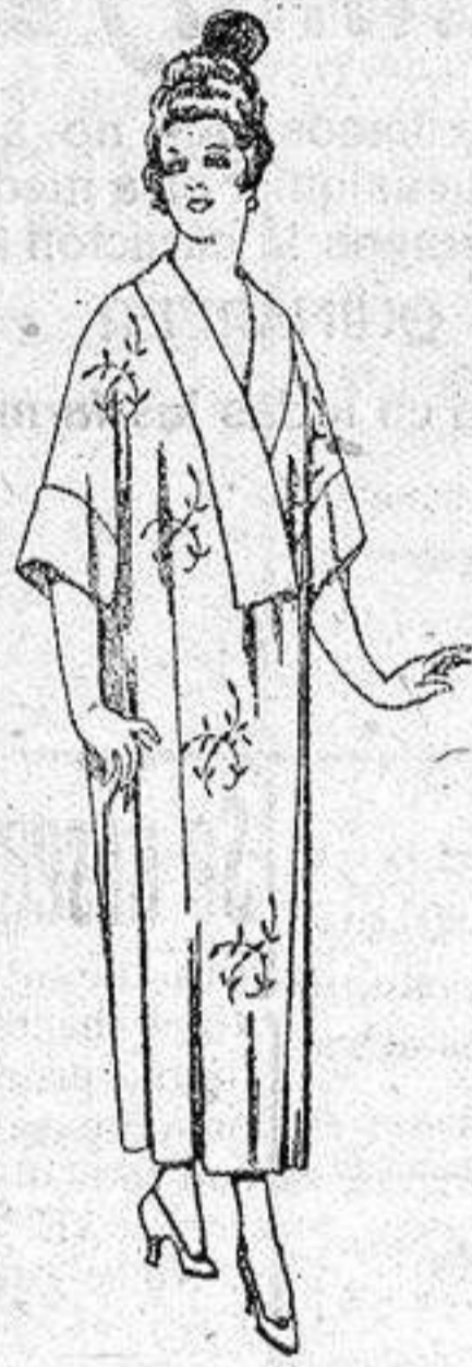
Batas de esterilla «Matting», adornos bordados, de pesetas 45 a 58.