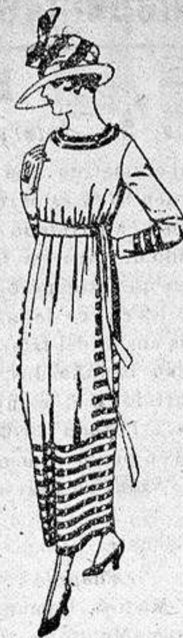
Vestidos de sarga inglesa estambre, etc., en negro azul y color, adornos tren-cilla de seda, de ptas 90 a 105.