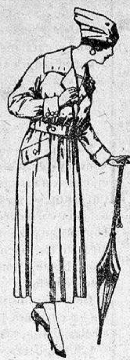
Abrigos de gabardina inglesa, impermeabilizados, diferentes colores, de ptas. 85 a 150.