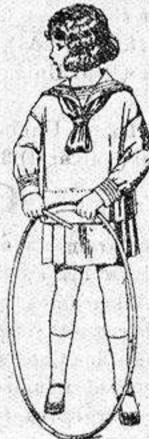
Trajes modelo «Marinera inglesa», de estambre o jerga azul, para niños de 4 a 9 años de pesetas 30 a 42