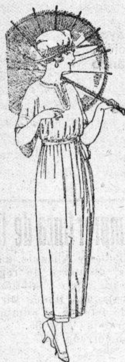
Vestidos de voile blanco y color, adornos bordados, de pesetas 45 a 58.