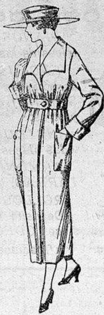
Guardapolvos de drill crudo, gris, etc., de ptas 14 a 28