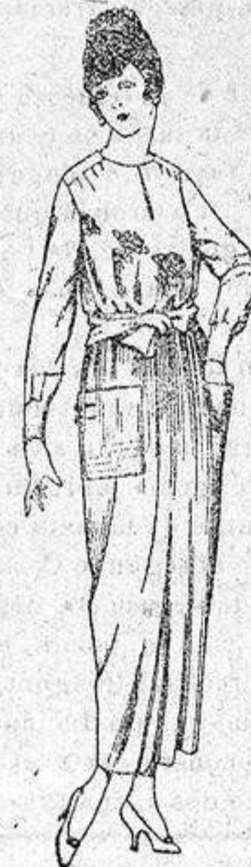
Blusas de crespón, voile, etc., en negro, azul y color, adornos bordados, de ptas 17 a 22. Faldas de lanilla, estambre, gabardina, etc., en negro, azul y colores, de ptas. 28 a 36.