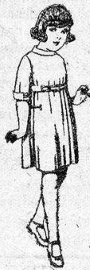
Vestidos de sarga inglesa azul, y adornos sarga blanca, para niñas de 4 a 9 años, de ptas 36 a 40.