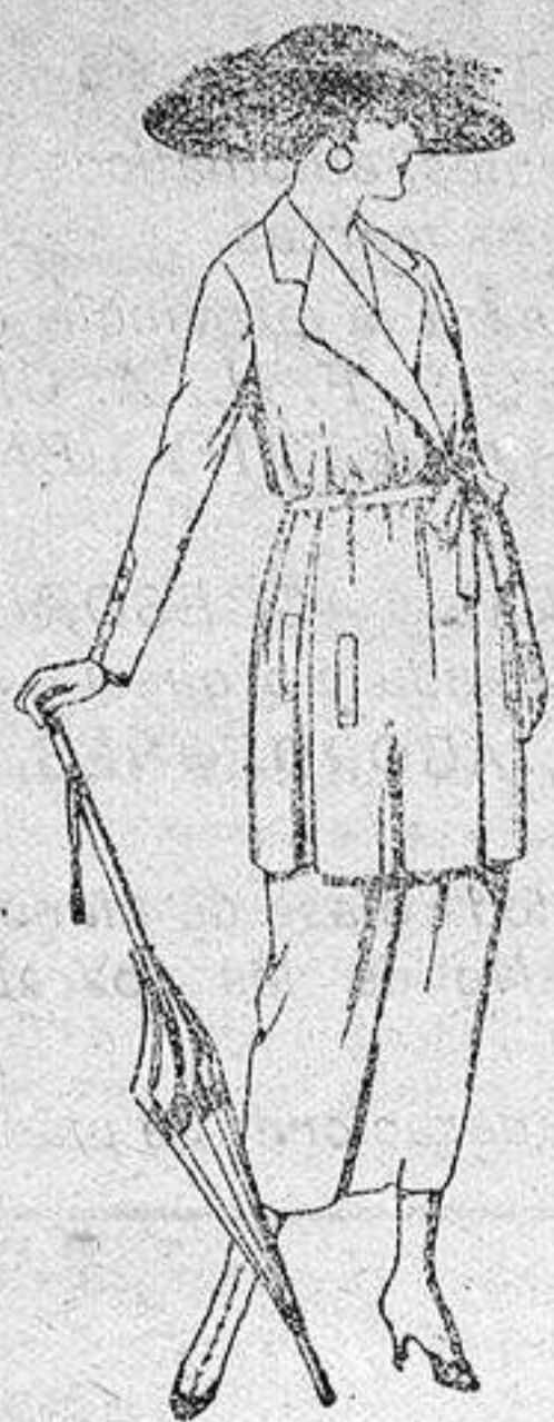
Trajes de estambre, lanilla, etc., en negro, azul y color, de ptas. 120 a 135.

SUCURSALES: Madrid, Barcelona, Almería, Bilbao, Cádiz, Cartagena, Gijón, Granada, Málaga, Palma de Mallorca, Santander, Sevilla, Valencia, Valladolid y Zaragoza.