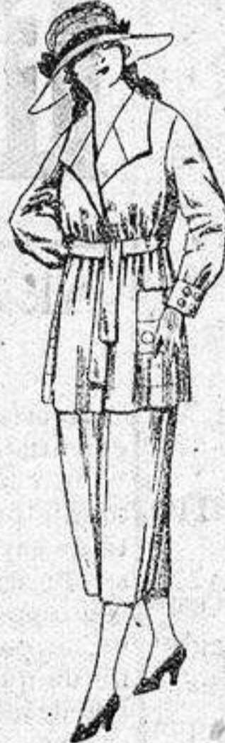
Trajes de estambre, gabardina, etc., en azul y color, de ptas. 68 a 79.