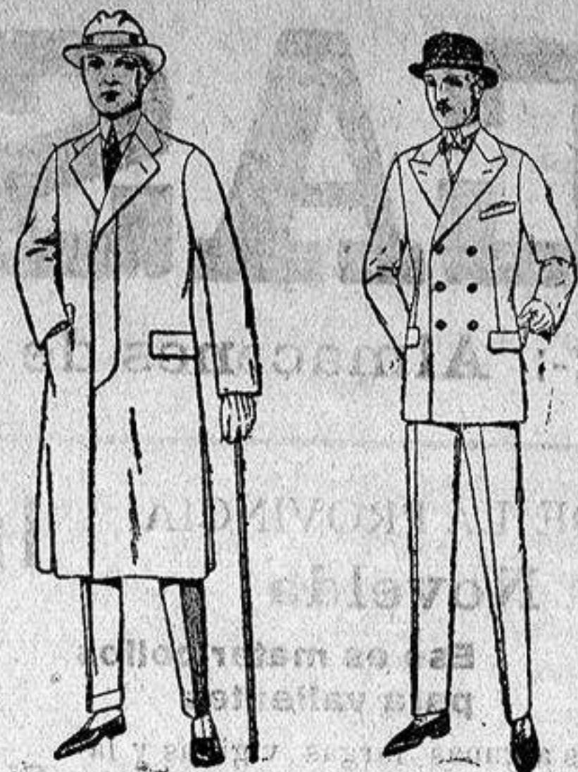
Trajes de melón, cheviot estambre, etc. De ptas. 38 a 150