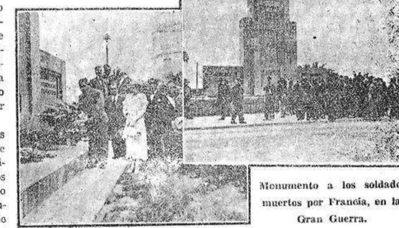
Monumento a los soldados muertos por Francia, en la Gran Guerra.

El Alcalde de Alicante, colocando un ramo de flores naturales al pie del monumento