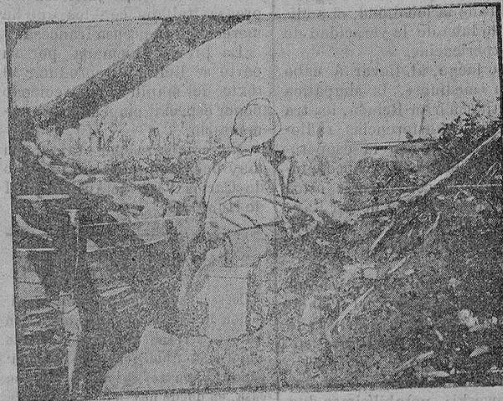
Trinchera tomada á los alemanes

Y hemos dicho nosotros: —Pero Pamplona, mi pueblo, la capital de la «viril Navarra», estos compatriotas nuestros que como nosotros tienen quizá más sangre francesa que española en sus venas, y son