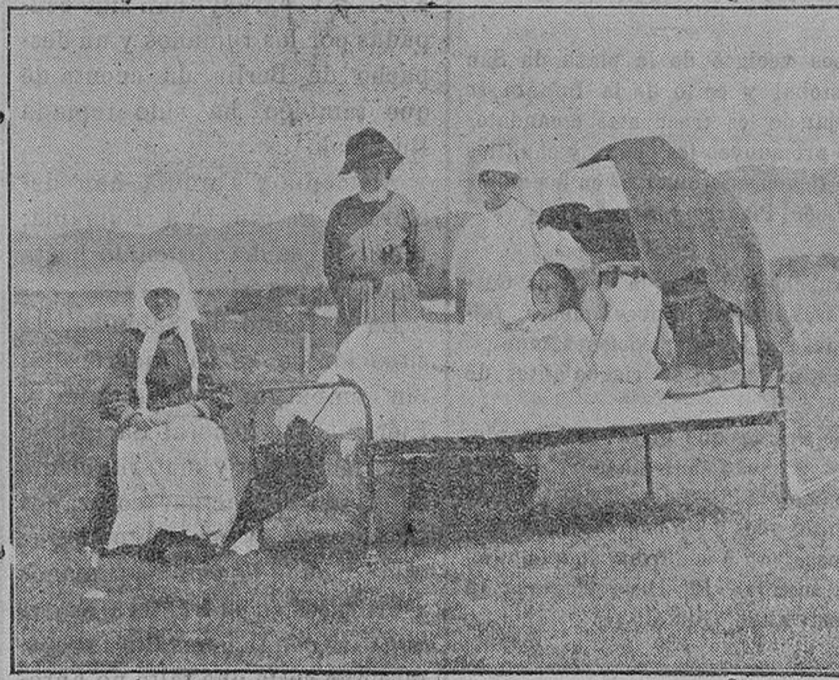
Una ambulancia de damas de la Cruz Roja aliada