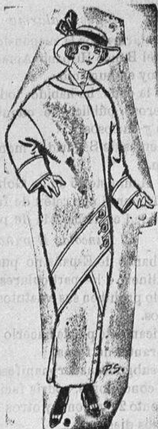
Abrigos de paño para jovencitos de 14 a 16 años De Ptas. 18 a 26

Madrid, Barcelona, Almeria, Bilbao, Cádiz, Cartagena, Gijón, Granada, Málaga, Palma de Mallorca, Santander, Sevilla, Valencia, Valladolid y Zaragoza.