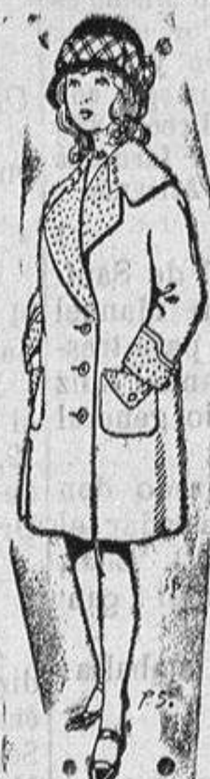
Abrigos para niñas de 4 a 12 años De pts. 15 a 24

Ropas confeccionadas para Caballeros y Niño y Artículos de la Temporada