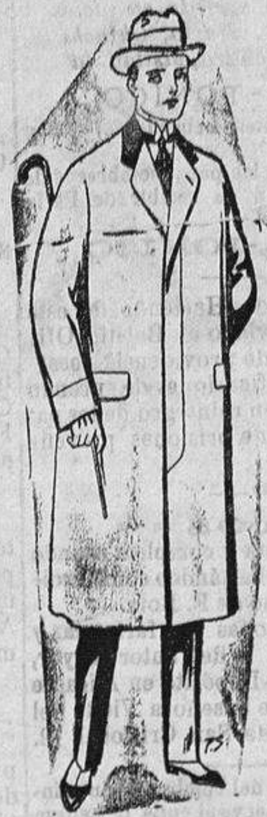
Gabanes de paten, ch-viot ó melton De 25 a 100 ptas.

Madrid, Barcelona, Almeria, Bilbao, Cádiz, Cartagena, Gijón, Granada, Málaga, Palma de Mallorca, Santander, Sevilla, Valencia, Valladolid y Zaragoza.