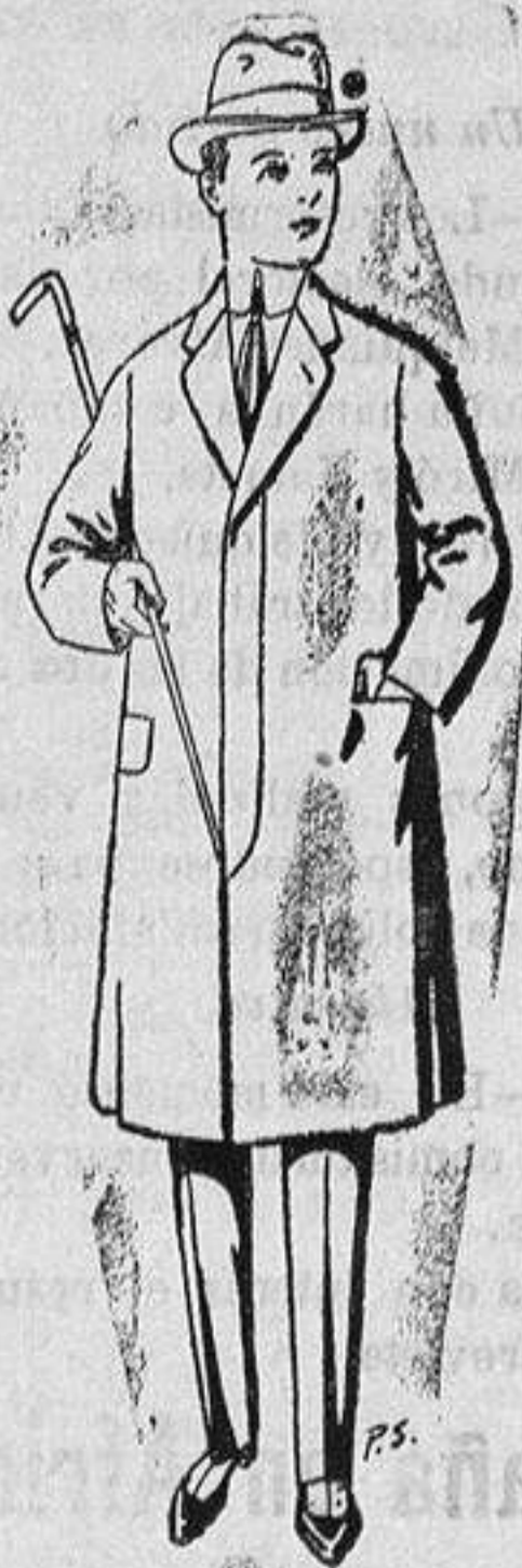
Gabanes de lana para jovencitos de 10 a 16 años De ptas. 14 a 50