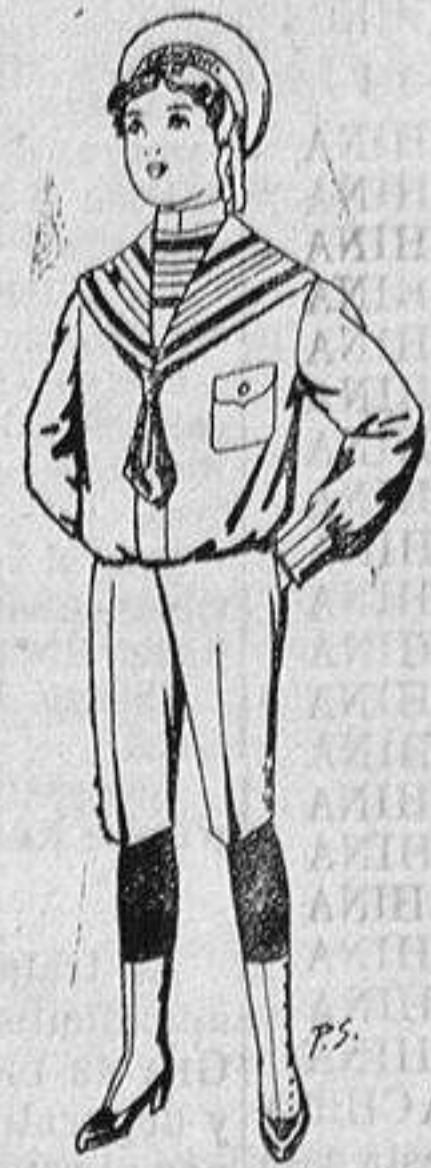
Trajes de jerga, azul o negro para niños de 4 a 9 años De ptas. 10 a 26

Madrid, Barcelona, Almeria, Bilbao, Cádiz, Cartagena, Gijón, Granada, Málaga, Palma de Mallorca, Santander, Sevilla, Valencia, Valladolid y Zaragoza.