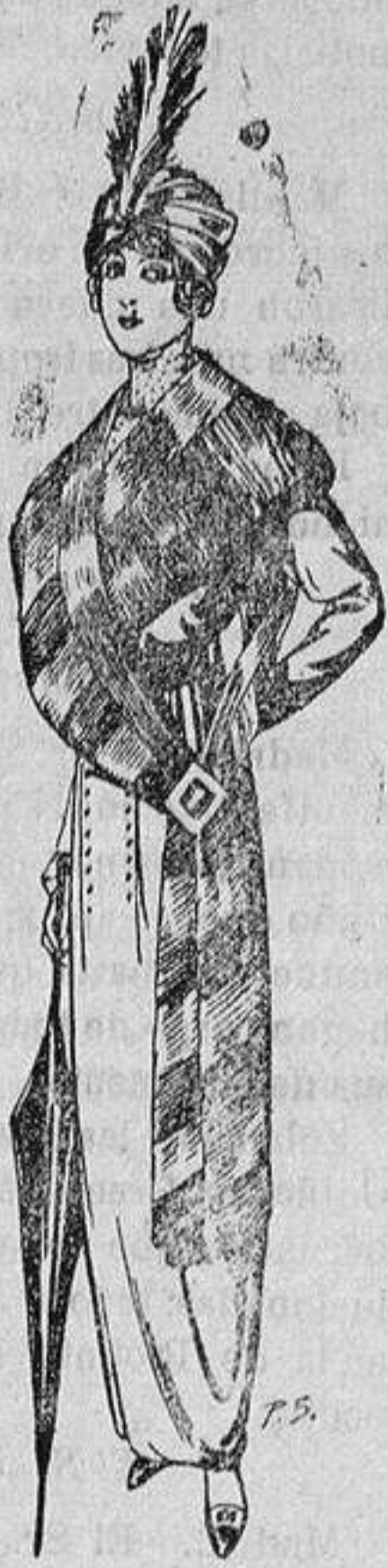
JUGO DE PIELS PARA SEÑORA DE TAUPE AUSTRALIA, A PTAS. 155

Madrid, Barcelona, Almeria, Bilbao, Cádiz, Cartagena, Gijón, Granada, Málaga, Palma de Mallorca, Santander, Sevilla, Valencia, Valladolid y Zaragoza.