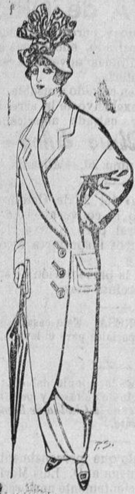
Abrigos de paten para señora De ptas. 22 a 30

Ropas confeccionadas para Caballeros y Niño y Artículos de la Temporada Confecciones de todas clases para SEÑORA y NIÑA