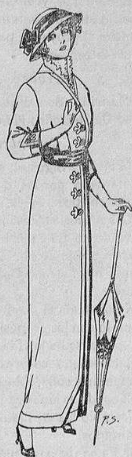
Vestido de lanilla, negro ó azul para señora, á Ptas. 22