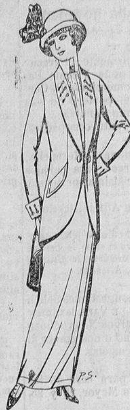
Traje de lanilla ó cheviot para Señora á Ptas. 65 y 70