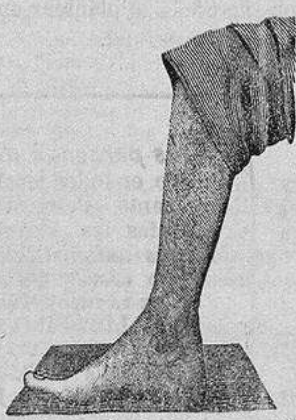
Después de la curación