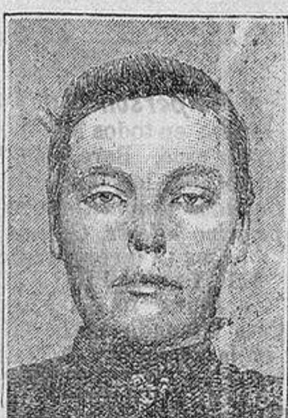
Después de la curación

En casa ha adivinado los lectores de este periódico el descubrimiento sensacional del RICHELET , Farmacéutico y Químico en Sedón de Francia, en lo que toca a las enfermedades de la piel. A qui la lis de estas enfermedades que han sido curadas, después de algunos días por este tratamiento maravilloso: