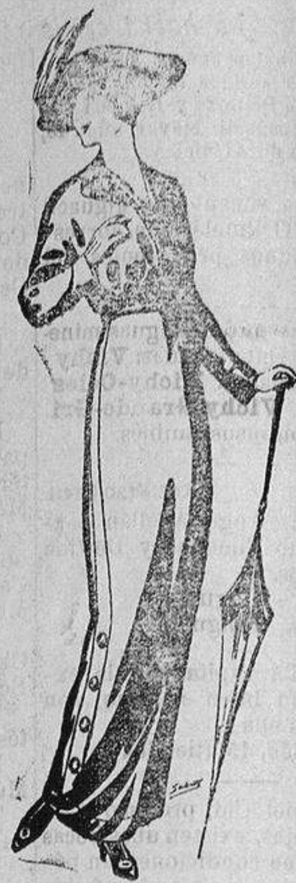
Trajes de lanilla cheviot de Ptas. 17'50 á 70

Ropas confeccionadas para Caballeros y Niño y Artículos de la Temporada