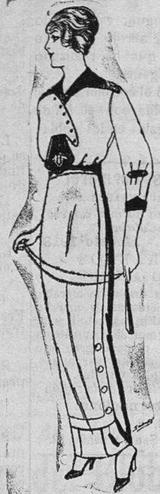
Blusa de seda blanca y colores, adornos bordados de Ptas. 25 Faldas de lanade Ptas. 11 a 22.

Ropas confeccionadas para Caballeros y Niño y Artículos de la Temporada