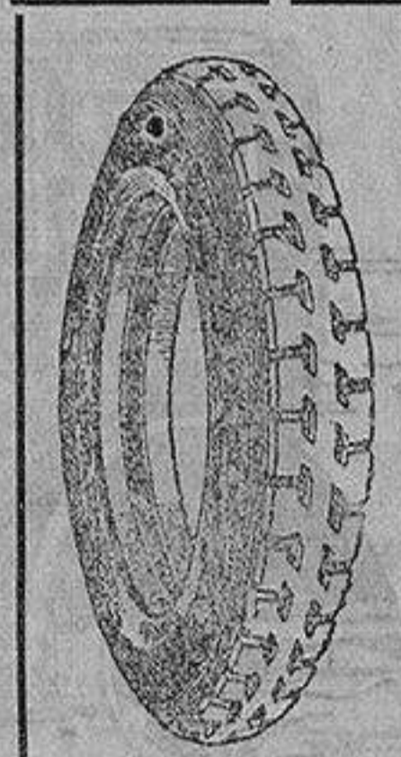
La cubierta recauchutada que le devuelve la fábrica.

que si usted adquiriera una cubierta nueva le dejaremos la que nos entregue rota para recorrer 20.000 kilómetros más.