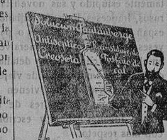
El mejor antiséptico de las vías respiratorias es la creosota.