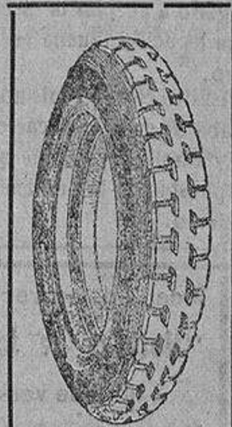
La cubierta recauchutada que le devuelve la fábrica.

que si usted adquiriera una cubierta nueva le dejaremos la que nos entregue rota para recorrer 20.000 kilómetros más.