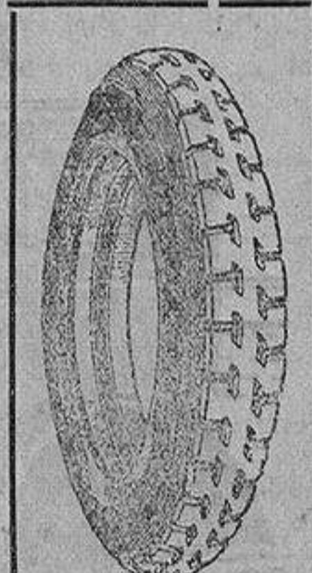
La cubierta recauchutada que le devuelve la fábrica.

que si usted adquiriera una cubierta nueva le dejaremos la que nos entregue rota para recorrer 20.000 kilómetros más.