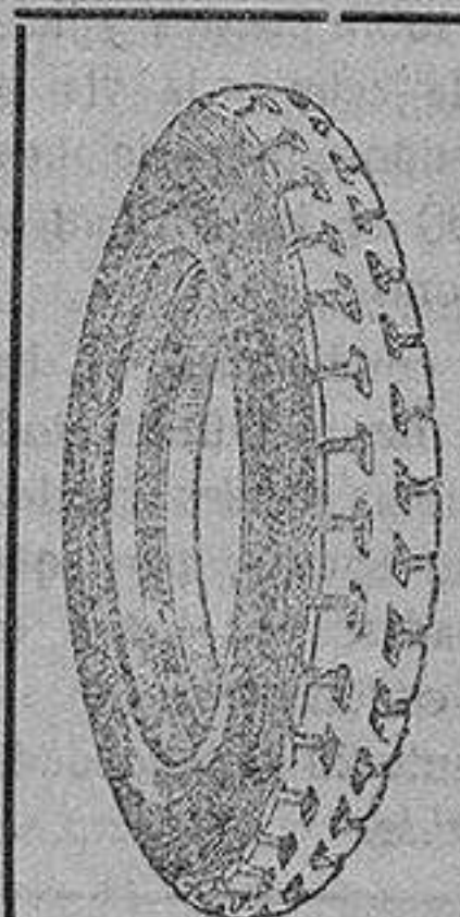
La cubierta recauchutada que le devuelve la fábrica.

que si usted adquiriera una cubierta nueva le dejaremos la que nos entregue rota para recorrer 20.000 kilómetros más.