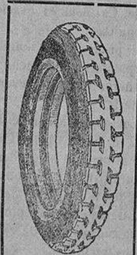
La cubierta recauchutada que le devuelve la fábrica.

que si usted adquiriera una cubierta nueva le dejaremos la que nos entregue rota para recorrer 20.000 kilómetros más.