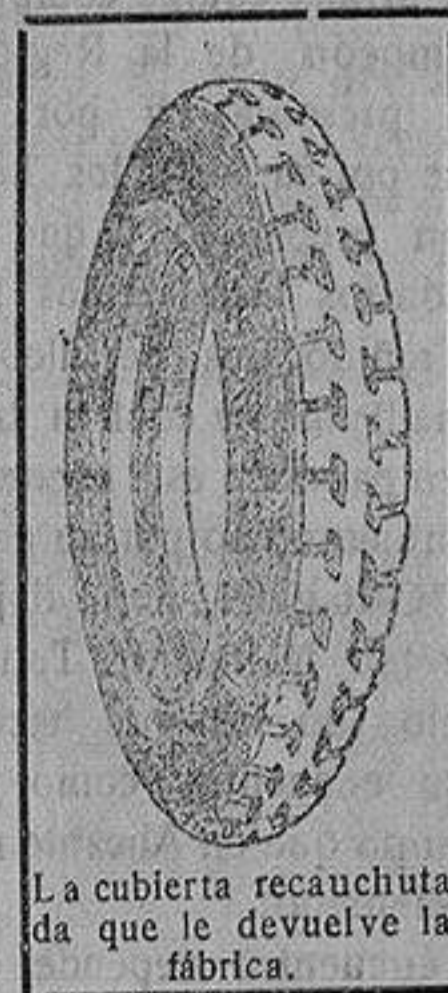
La cubierta recauchutada que le devuelve la fábrica.

que si usted adquiriera una cubierta nueva le dejaremos la que nos entregue rota para recorrer 20.000 kilómetros más.