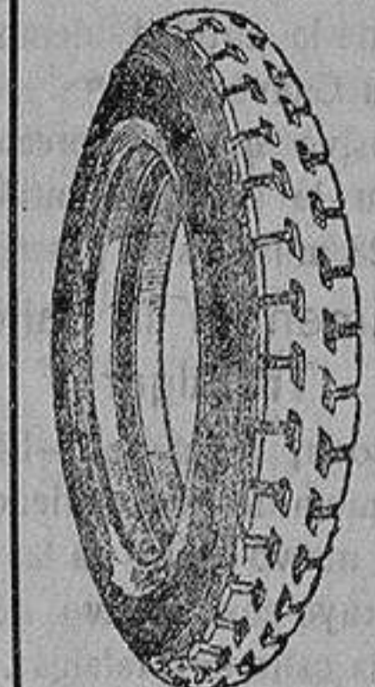
La cubierta recauchutada que le devuelve la fábrica.

que si usted adquiriera una cubierta nueva le dejaremos la que nos entregue rota para recorrer 20.000 kilómetros más.