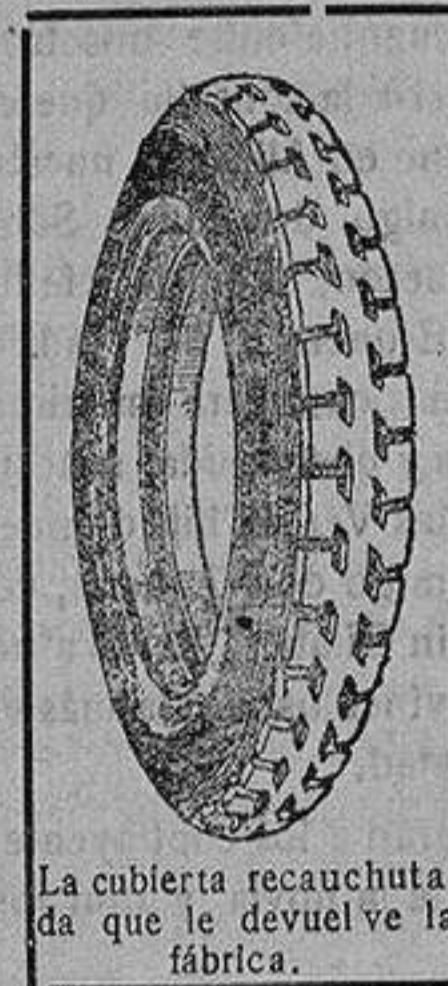
La cubierta recauchutada que le devuelve la fábrica.

que si usted adquiriera una cubierta nueva le dejaremos la que nos entregue rota para recorrer 20.000 kilómetros más.